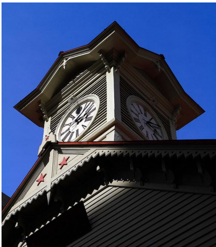
札幌钟楼

札幌钟楼又称札幌時計台，位于札幌市中央区北 1 条 2 丁目，是该市的著名地标，亦是北海道少数保存至今的美式建筑，现已被列为札幌最重要文化遗产之一。过去每到整点，钟楼的报时鸣钟便会响彻札幌市内。札幌钟楼内设有关于钟楼历史的小型展览，作为观光客摄影留念的场所极受欢迎。