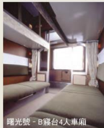
曙光號 - B寢台4人車廂