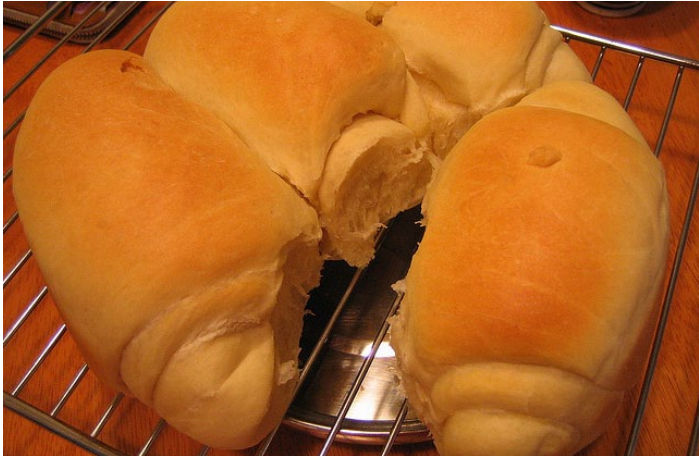
牛奶吐司

北海道的乳制品都很值得买，由于奶糖没有特色，牛奶又不方便携带，所以向大家推荐最近比较受好评的北海道牛奶面包。