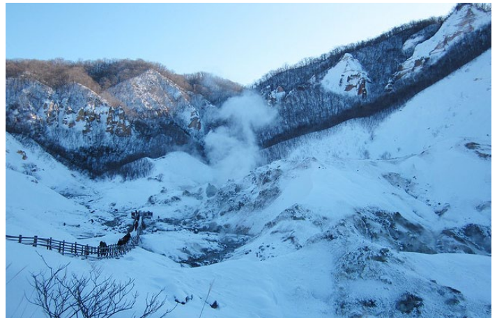
登别地狱谷 ++ 摄

它是火山爆发后，由融岩所形成的一个奇形诡异的谷地；灰白和褐色的岩层加上许多地热自地底喷出，形成特殊的火山地形景观。山谷是直径为 450 米的爆裂火口，别看它寸草不生，所流出的泉水正是具有特殊疗效的温泉，出水量每分钟高达 3000 立升。