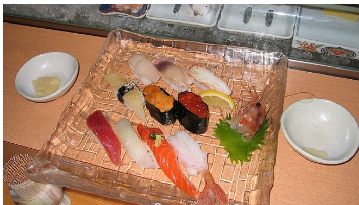
北海道寿司 wukong 悟空 (Xuemin Guan) 摄

北海道又称寿司王国，四面环海的北海道是新鲜海产的宝库，寿司是日本一种独特的美味佳肴，北海道的寿司与本州的寿司相比，因更多的使用扇贝、姥蛤、螃蟹和海胆做材料，颇受日本人及海外人士喜欢。