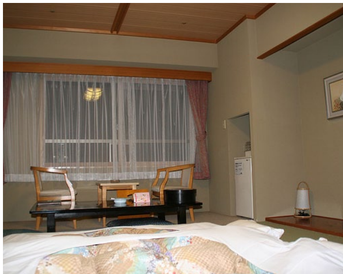
Hotel Mahoroba fitect 摄

位于北海道的绝佳浪漫，spa 水疗，观光地段，麻哈若巴酒店提供最好的环境，让您远离尘嚣。在这里，旅客们可轻松前往市区内各大旅游、购物、餐饮地点。