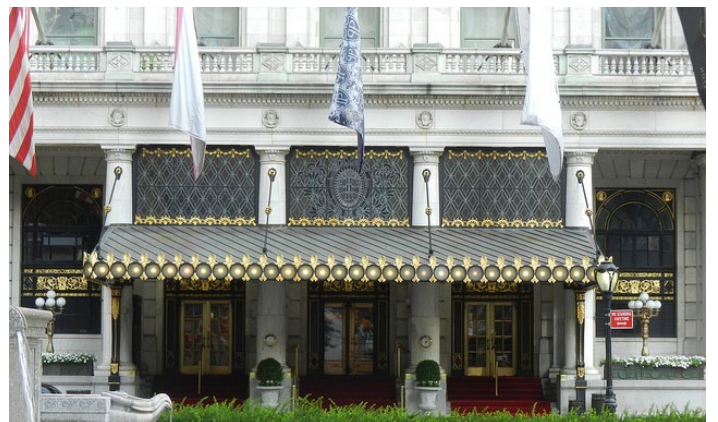
函馆 History Plaza

利用六栋相连而成的金森仓库群的一部分构成了函馆 History Plaza。金森博物馆里有来自全国约 20 家的精品店所组成的购物区是最大的卖点。其它还有餐厅、啤酒厅等。