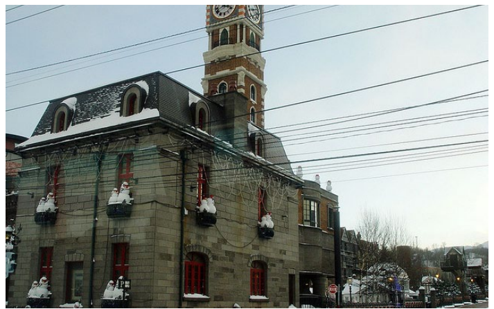
白色恋人巧克力工厂

巧克力工厂不仅有着展示巧克力的发展史和制作过程的巧克力博物馆，和能够买到正宗的“白色恋人”的商铺，还能亲身体验自制巧克力的过程与乐趣。只需购买相应的原材料，在店员的指导下，就能制作出各式各样美味又好看的巧克力甜点。