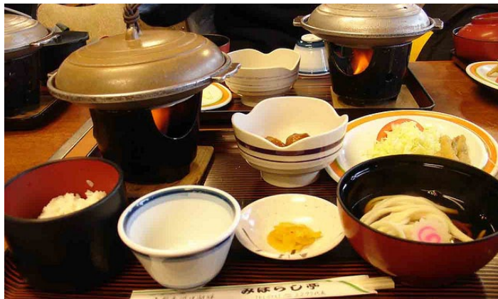
日式火锅

在安放在餐桌上的特制铁锅中，放入薄牛肉片、各种蔬菜、豆腐和带甜味的调料汁后边煮边吃。