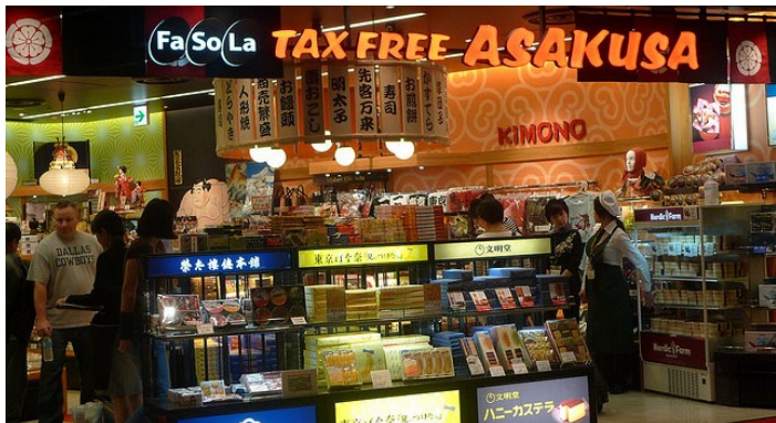
白色恋人巧克力