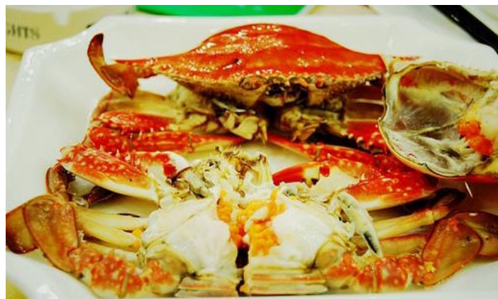
清蒸梭子蟹 zhou+ 摄