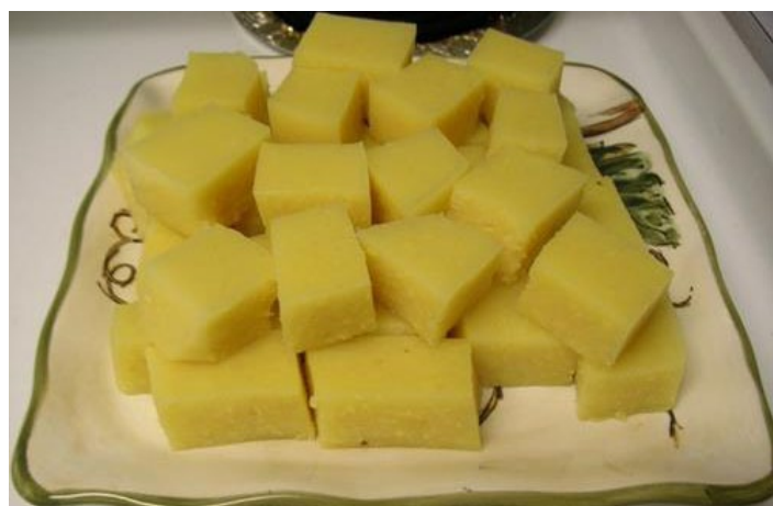
回记绿豆糕 asmine's Garden 摄

清真食品，用当地所产绿豆以及白糖，依秘方调制而成。油而不膩，松软香甜，口味醇正。