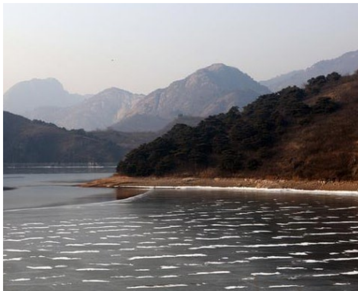
燕塞湖冬景