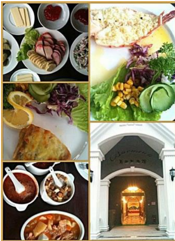
瓦西里酒馆

北戴河一家非常有特色的俄罗斯餐厅，除了独特风味的俄罗斯美食之外，俄罗斯美女服务员也是一大亮点。