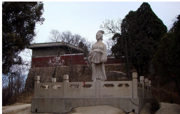
孟姜女庙德瑞克的旅游好好玩摄

每逢庙会，海内外游客云集于此，可品味精美风味小吃，可欣赏当地秧歌、二人转、杂耍等民间艺术表演。