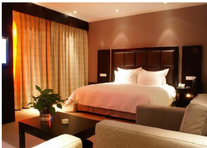
秦皇岛山海假日酒店

酒店坐落在山海关古城内，系仿古庭院式明清建筑，在这里您可以感受到仿古合院文化魅力，以及古朴高雅的“格格”所提供的精心服务。周边景区：天下第一关、老龙头及海滨浴场、角山长城、燕塞湖鸟语林、长寿山森林公园、乐岛欢乐海洋公园。