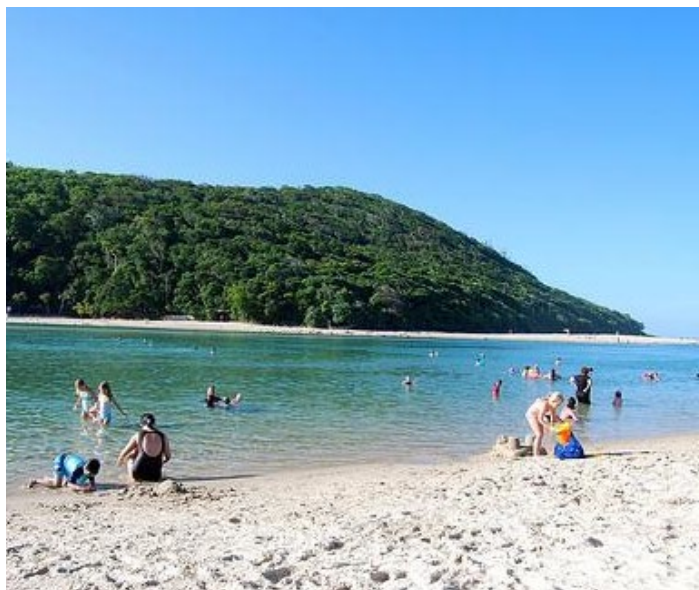
黄金海岸

美丽的秦皇岛黄金海岸位于渤海岸边，具有沙细，滩软，水清，潮平的特点，是进行海水浴、阳光浴、沙浴、森林浴、空气浴的理想地点，此外黄金海岸最吸引人的运动就是滑沙了。