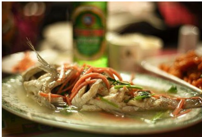
清蒸加吉鱼

清蒸加吉鱼，原汁原味，鲜嫩爽口，久食不腻，常作高档筵席的大件菜。吃时外带姜末、醋碟用以蘸食，口味尤佳。