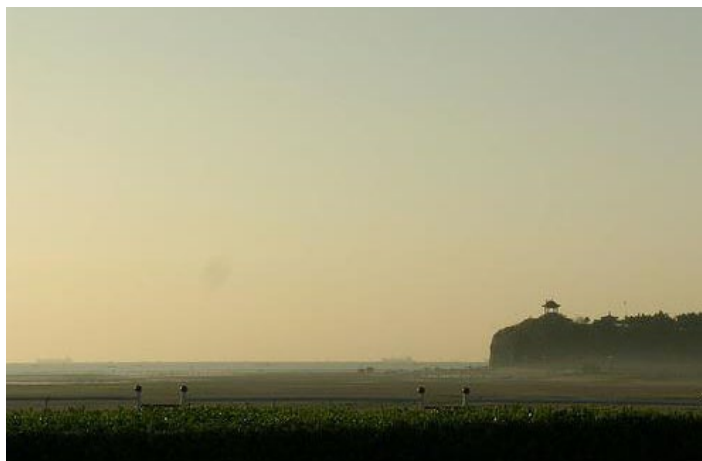
北戴河东海滩 smarthneddy 摄

地处河北省秦皇岛市中心的西部，是秦皇岛的城市区之一，是中国开发最早的海滨度假区。北戴河海滨有二十里长、曲折平坦的沙质海滩，环境优美，沙软潮平，沙质较好，坡度也比较平缓，是一个优良的天然海水浴场。