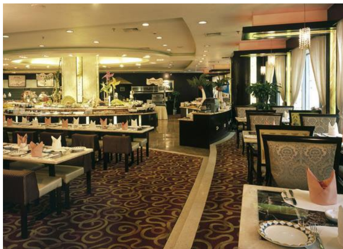
秦皇岛望海度假村餐厅

秦皇岛望海度假村座落在万里长城起点老龙头旁边，距海只有 50 米，环境优美，交通便利。内设置会议大厅，标准间、豪华别墅、餐厅及露天花园酒吧、铁板烧和一系列休闲旅游设施，是集疗养、度假、会议、休闲于一体的综合度假村。