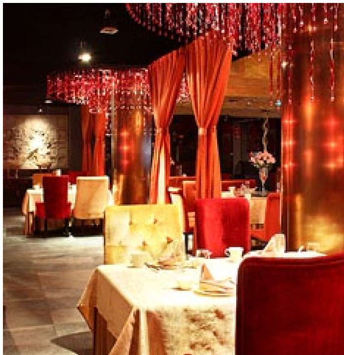
秦皇岛如意山海酒店餐厅

秦皇岛市如意山海饭店位于秦皇岛市区，梦幻般的海滨浴场、繁华闹市中心、火车站、汽车站近在咫尺，国家体委训练基地，奥体中心、大学城、汤河公园举步可达，环境优美，交通便利。