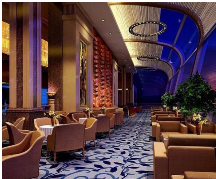
云天海湾假日酒店大堂吧

秦皇岛市云天海湾假日酒店位于秦皇岛市河北大街汤河西侧，东临汤河、南观渤海、酒店位置交通便利，秦皇岛市云天海湾假日酒店内外装饰由意大利名家设计，风格简约、别致。室内家具、饰品、装潢无不让您仿佛置身于爱琴海沙滩，感受浓郁的西西里风情，享受蓝天碧海、清风晨露的惬意与悠闲。