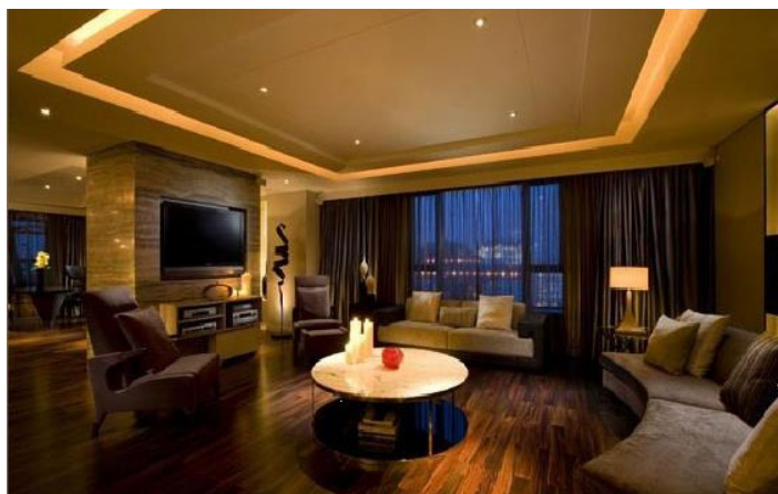
半岛四季酒店公寓

半岛四季酒店公寓位于秦皇岛市中心区域，文化路与河北大街交叉口，到商业街区便捷方便。整个酒店公寓以令人瞩目的现代生活模式为理念，集客房、会议、运动健身、餐饮、儿童游乐、养生休闲六大元素于一体，成为尊享四季的空中花园。