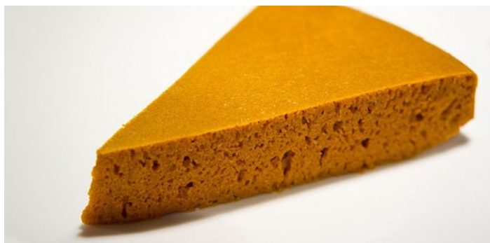
苦荞粑粑

小凉山地区盛产苦荞，苦荞在彝族人心中是五谷之王，苦荞粑粑是当地的一道风味食品。在祭坛、起房、婚嫁、待客宴席上总是有苦荞粑粑。食用时，蘸蜂蜜进餐，苦甜爽口，回味无穷。