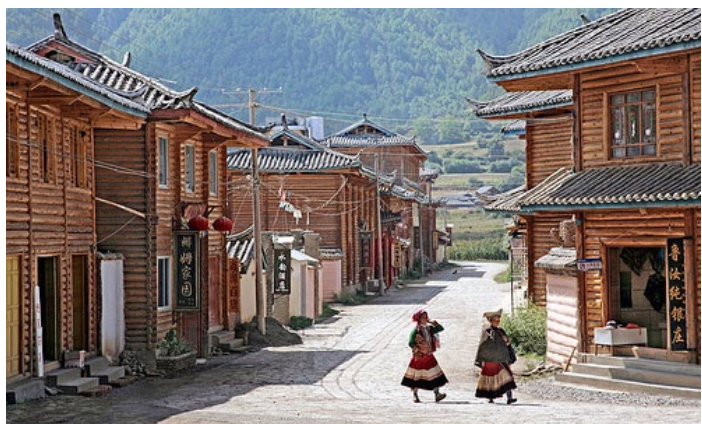
大落水村村口

在大落水村，沿湖岸都是摩梭人家的木房子，现在多数都改造为可提供住宿的旅馆。晚上，当地的摩梭人会穿起传统服饰，表演歌舞。小路旁湖畔垂柳、木舟细浪、风光迷人，这里自然成为旅游者的聚集地。