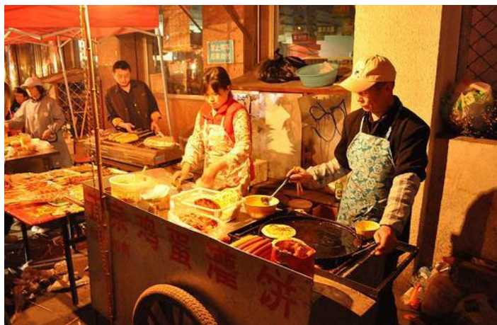
泸沽湖烧烤

泸沽湖一带处处都有烧烤。这里的烧烤与别处有很大区别。烤乳猪、烤泸沽湖鱼等等都是当地特色。比较有名的烧烤摊有拉姆烧烤、缘聚阿桑火塘、扎西家等等。