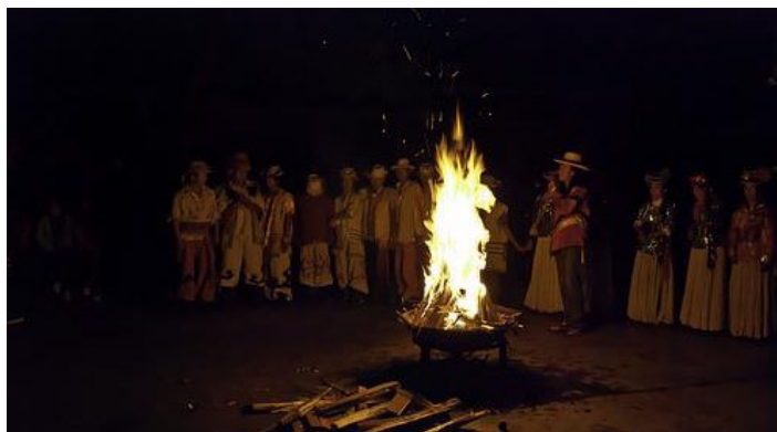
小落水篝火晚会