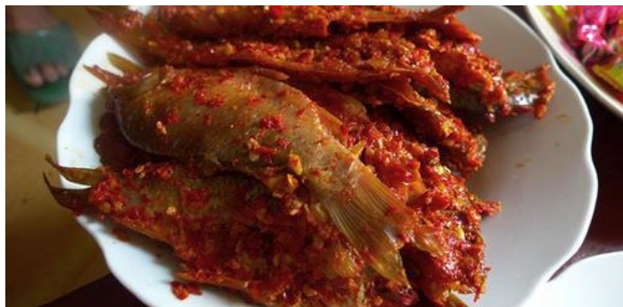
腌酸鱼 止疼片 摄

腌酸鱼是宁蒗摩梭、普米人家待客的传统佳肴。当地人选用泸沽湖中捕捞的鲜活裂腹鱼，将活鱼放进陶罐里，放一层鱼撒上一层糌粑面、食盐等佐料腌制而成。腌酸鱼可生吃，也可炒吃或放上辣椒煮成酸辣汤，味道鲜嫩爽口。