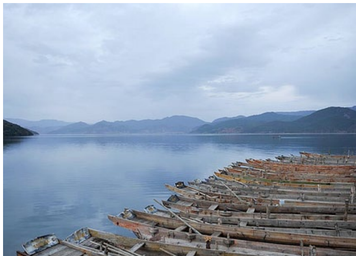
泸沽湖码头