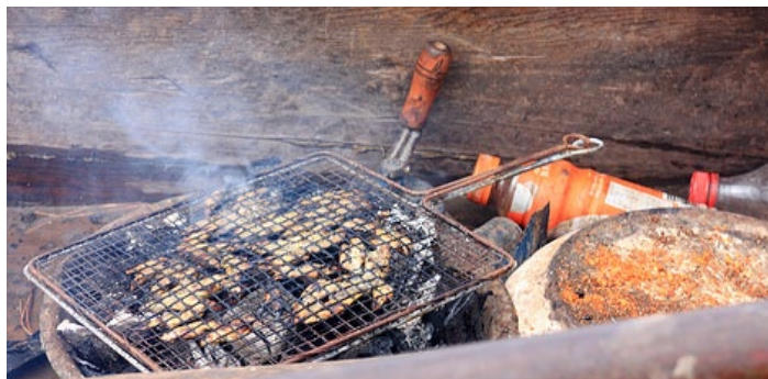
烤鱼现场

烤鱼干的主料是一种泸沽湖特产的巴鱼，将巴鱼处理干净后，撒上盐、花椒和五香粉，放置在火塘上或铁锅内缓慢烤干制成。在品尝这种烤鱼干时，将其在炭火上烤熟或用清油炸酥，味道香脆可口。