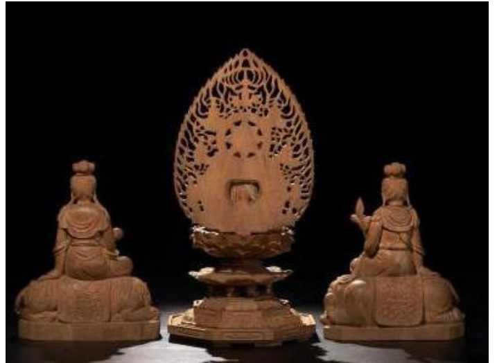
木易工房 木雕 - 摄

越南的木雕工艺品久负盛名，大多选用越南中部西原地区或邻国老挝、柬埔寨原始森林中出产的优质硬木作原料。选择檀香木、楠木或其他一些带香味的木料刻制的木雕时，最好不要上漆的，这样香气才能散发出来，抚摸日久，会愈加光滑。