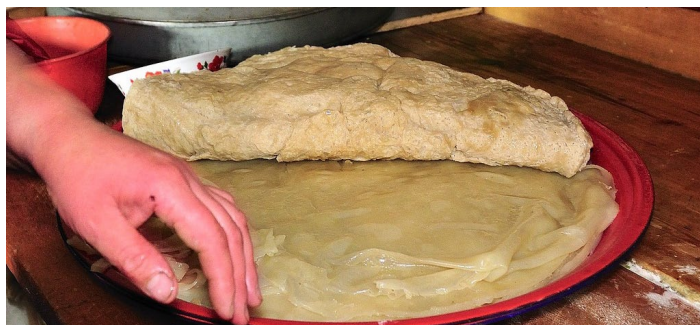
奶皮 darklord14 摄

是门源地区独特的回族名间奶制品，是牛奶煮沸后扬动起泡，再静置一段时间后由悬起的脂肪沫等凝结而成的物质，是牛奶的精华部分。门源奶皮精选青藏高原纯天然原料，按照现代营养需要精制而成。富含优质蛋白，脂肪以及钙、铁、锌等多种人体所需的微量元素。