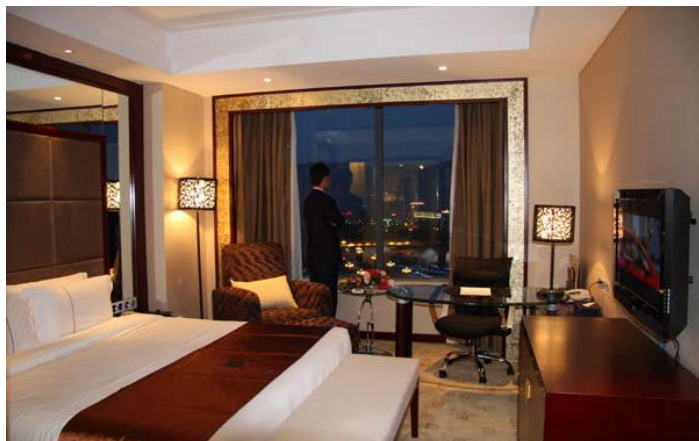
青海宾馆

位于西宁市中心，为四星级涉外旅游饭店，是西宁最豪华的宾馆。在火车站可坐 22 路车到儿童公园下。房间装修档次不一：最高 295 元 / 标间，最低 198 元 / 标间，24 小时有热水。