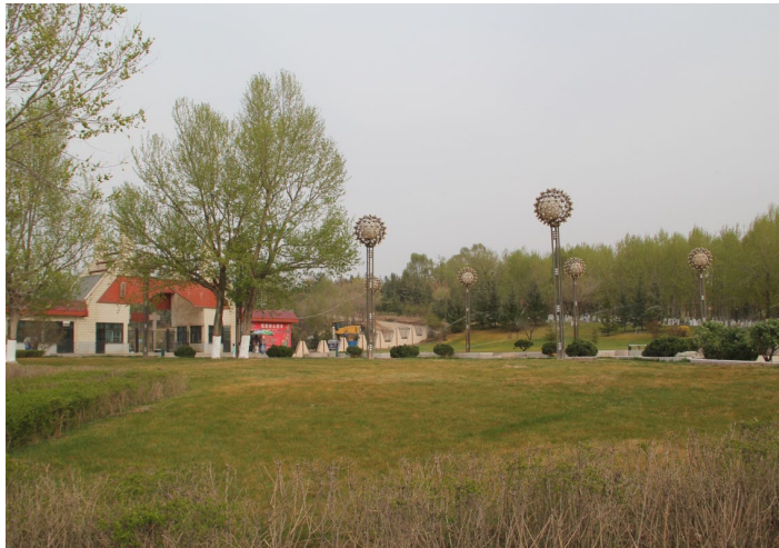
南山公园

为山林漫步区、五彩流溢景区、金桐留凤区、登高远眺景区、儿童游乐区、休闲垂钓园、藏族风情园、浦宁友好园和餐饮区，整个公园风景秀丽，是一处休闲观景的好地方。