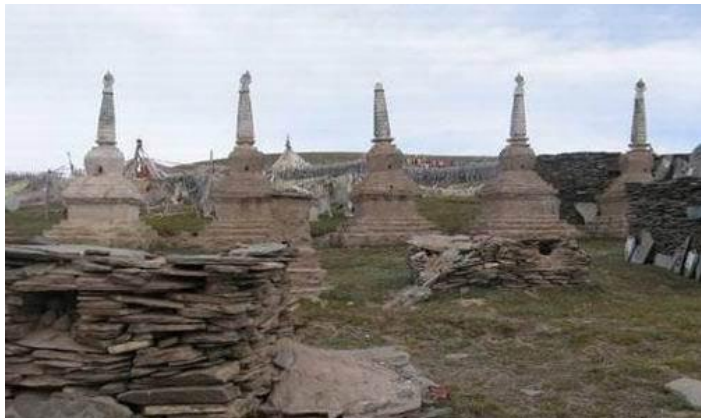
格萨尔遗迹

的《格萨尔》史诗。治多县民间自称是《格萨尔》中的女主人公、绝世佳人珠姆的故乡，有关格萨尔的遗迹和故事遍布治多山川河流，如“格萨尔磨刀石”、“格萨尔马蹄印”、“珠姆马圈”、“充满传奇色彩的天然石桥”、“石桥岩石上的羊蹄印、狗爪印及人脚印”仿佛在向世人诉说曾经发生在这儿的故事故事。