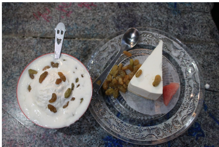
牦牛 酸奶坊

青海的酸奶是那种固体的老式酸奶，虽然是固体，但是酸奶非常鲜嫩，有淡淡酸味，很开胃一点儿也不腻人。藏民的帐篷里都有出售，一般是5元一碗，都是现挤的牛奶做的，一定要品尝一下哦。