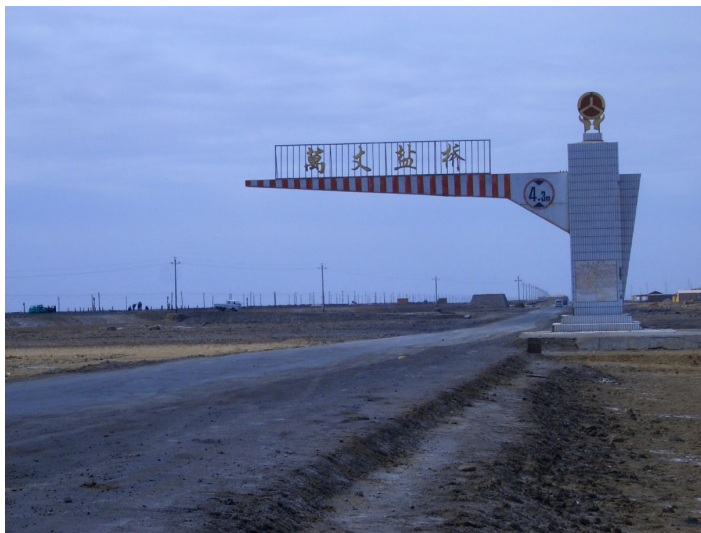
万丈盐桥

交通：从格尔木市区包车前往万丈盐桥的往返费用约为 150 元 / 车（可坐 4 人）。