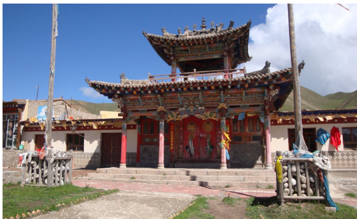
文成公主庙 山里红 2012 摄

文成公主庙，又称大旦如来佛堂，坐落在结古镇以南的白纳沟，海拔 3700 多米。大旦如来佛堂面积有 80 多平方米，高 13 米，依悬崖修建而成。佛堂精巧玲珑、幽静雅致。佛堂内供奉的主佛像藏语称“觉俄囊巴诺泽”，汉语称大旦如来，梵语为“毗卢遮那”。