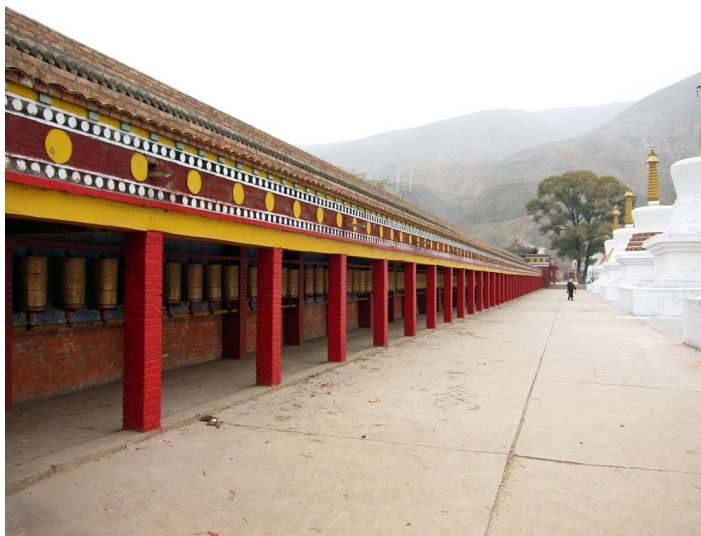
1101_27_青海吾屯下寺

吾屯下寺占地约 80 亩。寺中重要文物有清朝檀香木雕弥勒佛像等省级文物，并藏有相传自印度迎请的五粒释迦牟尼佛发舍利，作为镇寺之宝供奉于释迦牟尼佛像内。此外还供养有僧舍利一千余粒，火化时呈现香气四溢等异相。