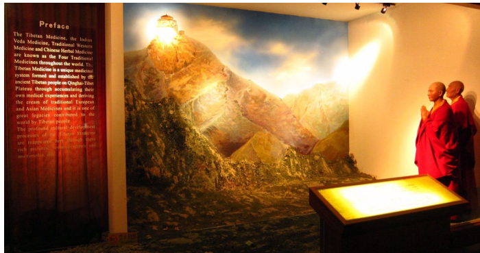
西青藏医药文化博物馆

世界上独一无二的藏医药专业博物馆，由藏药公司建造，位置在城南生物园区，尽管交通有些不便，门票价格也不便宜，但如果你对藏文化尤其是藏医药感兴趣，这里绝对值得一看。全部解说文字都有汉藏文对照，不过，要想深入了解藏文化，最好请一位藏族导游讲解。