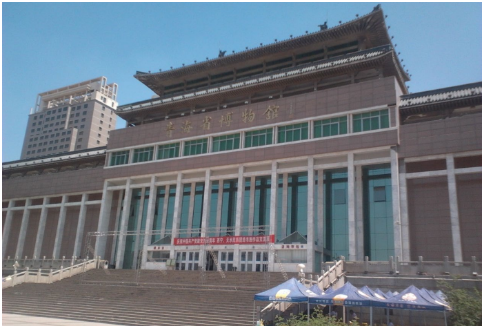
青海省博物馆门口

馆内固定的展区有几个很值得一看的专题展览：青海湖国际公路自行车赛陈列，介绍历年环湖赛的路线和赛况；唐卡艺术展，展出制作唐卡的工具、颜料、画笔和一些别处难以见馆内固定的展区有几个很值得一看的专题展览到的清代、民国青海唐卡；藏毯工艺展…等等。还有不少明清密宗佛像值得细看。如果你准备到藏地旅行，不妨在离开西宁前到这里来预习一下藏传佛教的文化和艺术。