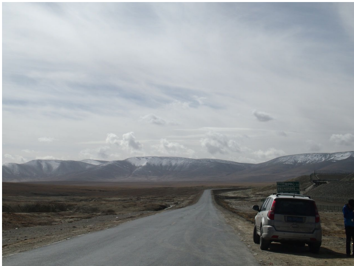
可可西里

可可西里是目前世界上原始生态环境保存最完美的地区之一，也是目前中国建成的面积最大、海拔最高、野生动物资源最为丰富的自然保护区之一。又被称为可可西里无人区，是中国最大、海拔最高、最神秘的“死亡地带”。