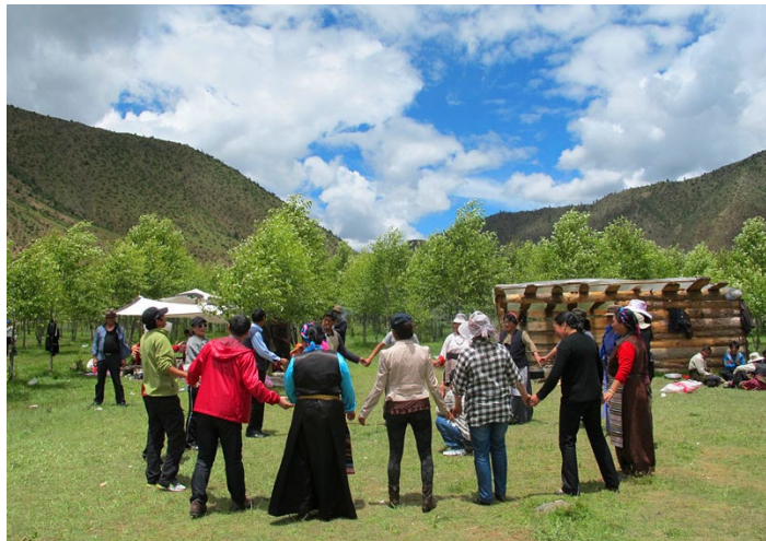
锅庄舞 艾素 许 摄

藏族的民间舞蹈，在节日或农闲时跳。男女围成圆圈，自右而左，边歌边舞。男性着肥大筒裤有如雄鹰粗壮的毛腿，女子脱开右臂袖袖披于身后飘逸洒脱。锅庄舞姿矫健，动作挺拔，既展舞姿又重情绪表现，舞姿顺达自然，优美飘逸。