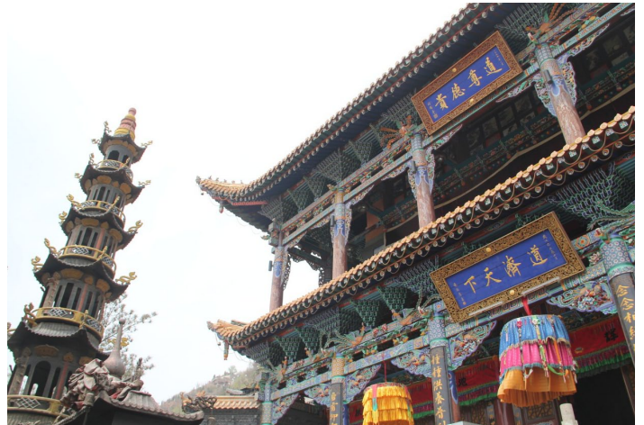
北禅寺

西宁北禅寺，始建与北魏，是我国第二大悬空寺，也叫土楼观，这里是丝绸之路南线必经之路，所以在这里流下了许多有名和尚的脚印，几千年的风雨将这的巨大佛像洗刷为了一道靓丽的风景。宁寿塔坐落在北山的山顶，山顶原有牌坊、三官殿、雷殿等，该塔为六面形五层翘角塔，塔中实心，青砖砌成。是明洪武十九年由驻西宁长兴侯耿炳文所建修。