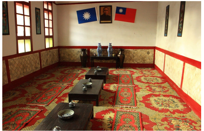
马步芳公馆_002

马步芳公馆是青海省保存最为完整的民国时的建筑，也是全国唯一一座选用玉石建造的官邸，具有较高的历史文物价值和浓郁的地方民族文化特色，1986 年被省政府确定为省级重点文物保护单位。