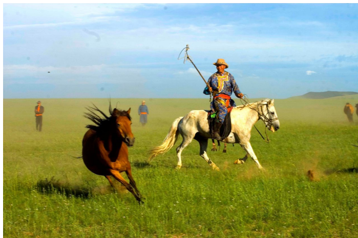
Lassoing Man in Nadam Fair 肖艺九 肖摄

那达慕蒙语是“娱乐”或“游戏”的意思。那达慕大会的内容主要有摔跤、赛马、射箭、赛布鲁、套马、下蒙古棋等民族传统项目，有的地方还有田径、拔河、排球、篮球等体育竞赛项目。参加马竞走的马，必须受过特殊训练，四脚不能同时离地，只能走得快，不能跑得快。总而言之，是不可错过的盛会。