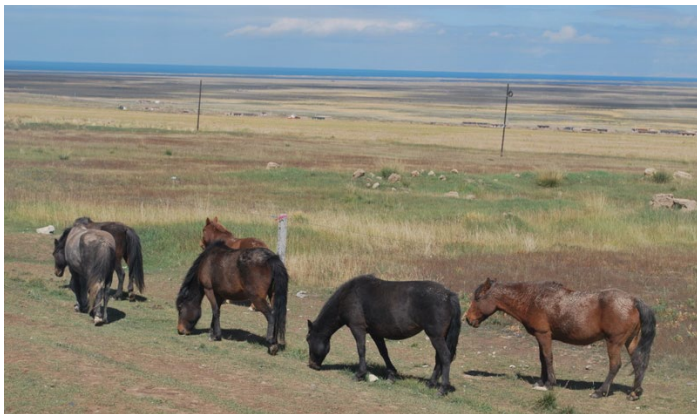
青海省草原 The pasture of Qinghai Provincetian yake 摄