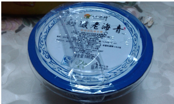
青海老酸奶

青海的酸奶是那中固体老式的酸奶。虽然是固体的，但是酸奶非常鲜嫩，有淡淡酸味，很开胃一点也不腻人。