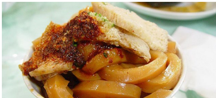
西宁酿皮

酿皮是青海地方风味较浓的传统小吃。配上面筋，浇上醋、辣油、芥菜、韭菜、蒜泥等佐料，就是上好的酿皮了。吃起来辛辣、凉爽、口感柔韧细腻，回味悠长。在西宁和农业区各城镇出售酿皮的摊贩到处可见。