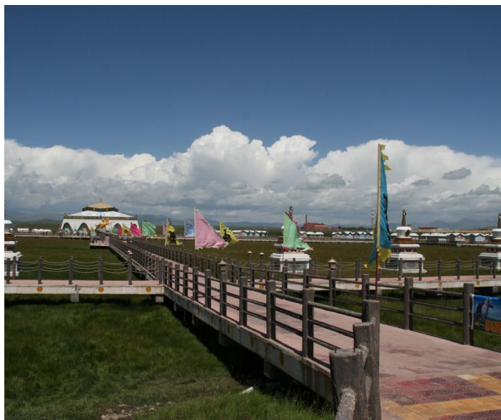
金银滩 - 帐篷宾馆 1 肥牛 1 摄

当地的青海湖帐篷宾馆（共和县青藏公路 151 公里处）是 2 星级宾馆。距日月山倒沿河景区 30-50 公里。房间类型有：蒙古包 280 元 / 间；甲等双标间 240 元；160 元的标间没有卫生间；另外还有三人间 90 元、四人间 80 元，都是公用卫生。热水供应时间为：晚上 20:30—23:00。旅游者也可以自己携带帐篷在湖边过夜。