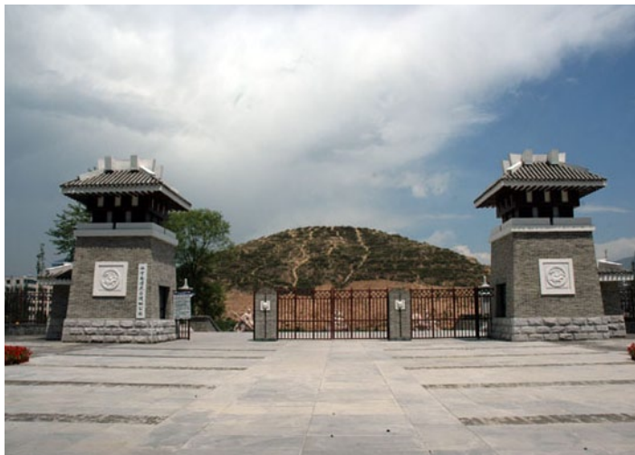
虎台遗址

虎台是东晋十六国时期南凉王在西宁建都时的重要遗迹，至今已有 1600 多年的历史。传说是樊梨花西征时点将的地方。原台共九层，台下可陈兵 10 万，台上用于军事检阅，现仅存土丘。这个高大的土台是南凉王朝第三代君王湟檀于公元 402 年，高台由黄土夯成，共分九层，高九丈八尺，用他的太子“虎”的名字命名修建的阅兵台，“虎台”之名由此而来。