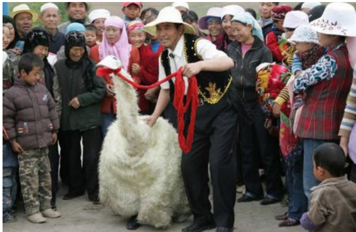
回族宴席曲

回族宴席曲：也叫“菜曲儿”，限制较少，随处可唱，并不局限于婚礼喜庆的祝福或节日的颂歌。演唱宴席运用的是娓娓、细腻、活泼、优美等声腔，有时竟至哀婉凄切。演唱时一般不要乐器伴奏，全凭丰富的声音、表情，取得感人的效果。