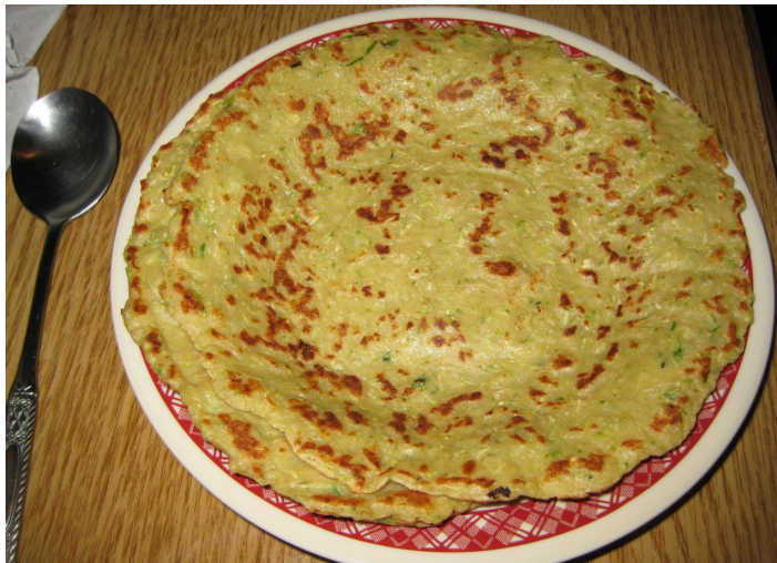
锅塌 vegetable

青海家常面食。在锅中焖成的底部似烙饼、上部似蒸馍的面食品。贴在锅底的一面烙成黄黄的硬底，上面则似蒸馍，蓬松酥软。过去多用青稞面，现在也用小麦面、豌豆面或包谷面。可做成单个的，也可在锅中把好几个贴到一起，做成一个大锅塌。