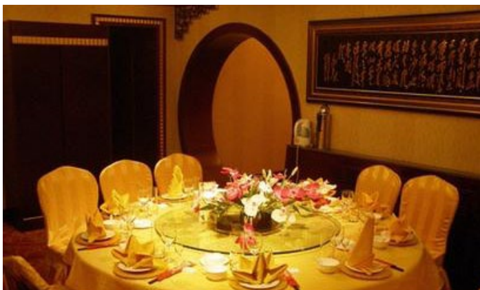
西宁大厦

是两星级宾馆。从火车站步行到这里只要 10 分钟，或乘 1 路公共汽车两站下车即可，如打的只要 4 元就足够了。新楼的两人标间价格为 165 元，房间里有热水供应，但到 24:00 以后就没有了，此外在大堂内有 IC 卡电话机。在后观的老楼里有两人带淋浴的房间，价格从 50 到 80 元不等。