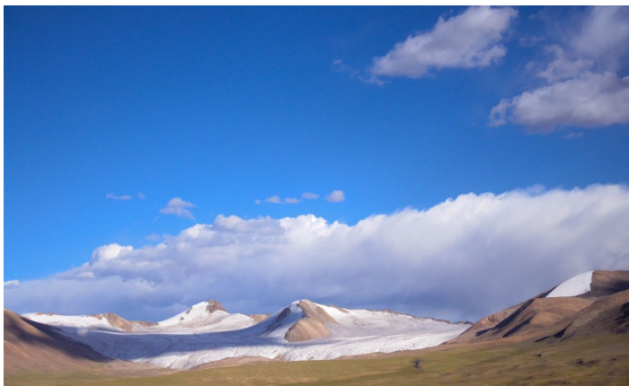
唐古拉山口

唐古拉山口为青海、西藏两省（区）分界线，海拔约 5231 米，是青藏公路的最高点。距青海省格尔木市 604 公里。山口立有为修建青藏公路而献身的人民解放军雕像纪念碑，海拔高度碑以及“军民共建兰西拉光缆工程竣工纪念碑”。