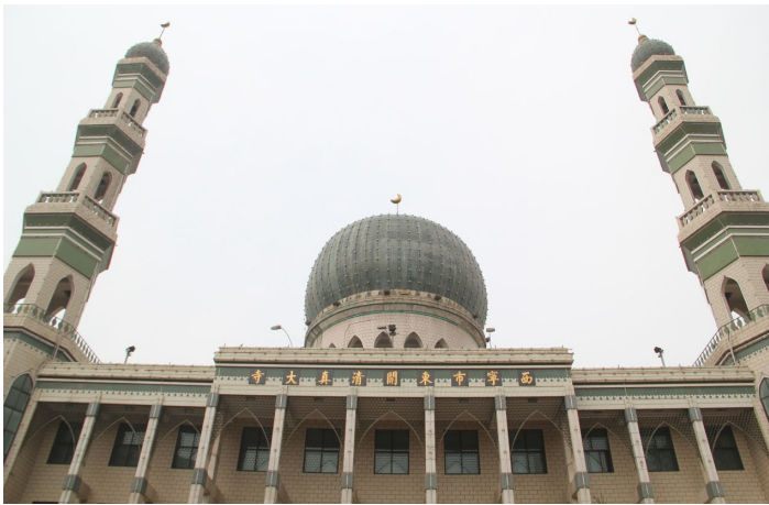
东关清真大寺