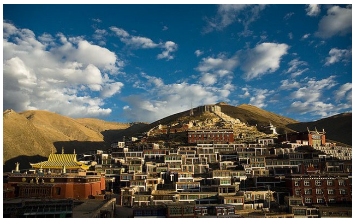
结古寺 KyeguMonasteryFeng Zhong 摄

结古寺藏语称“结古顿珠楞”，意为“结古义成洲”。结古寺以建筑宏伟、寺僧众多、文物丰富、多名僧高徒在我国藏区闻名遐迩。整个寺院依山势而建，殿堂僧舍错落有致，远望似多层楼阁耸立，主体建筑“都文桑舟嘉措”经堂系由萨边寺大堪布巴德秋君和嘉那活佛第一世多项松却帕文设计，在德格佐钦寺支持下，扎武迈根活佛主持修建，可容纳 1000 扎哇诵经。此外，讲经院、大昭殿、弥勒殿、嘉那和文保活佛院等都规模较大，且各具特色。