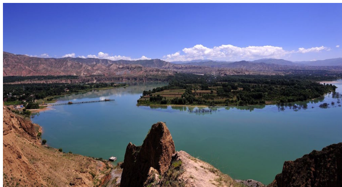
坎布拉森林国家公园

坎布拉国家森林公园位于黄南州尖扎县西北部，距离西宁市 130 公里。公园内山峰挺立，雄浑壮观，为典型的丹霞地貌。坎布拉又是藏传佛教后弘期的发祥地，有宗扎西寺、南宗寺、尼姑寺，成为显、密、僧、尼各教派并存的藏传佛教圣地，具有丰富的文化内涵。