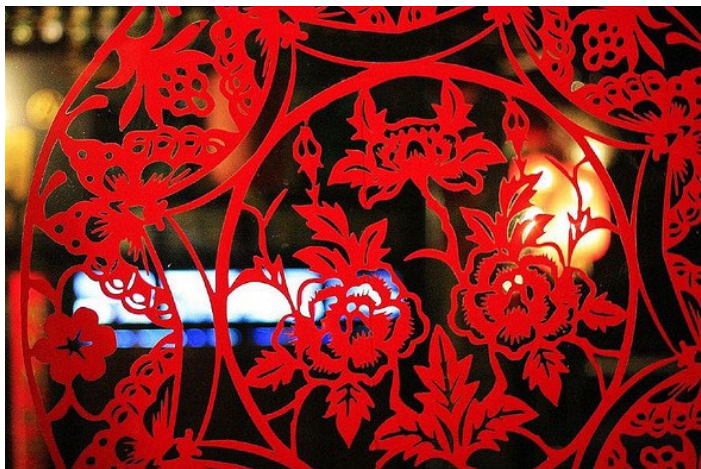
平遥剪纸 步量中国 摄

在平遥剪纸盛行形成一种特殊的文化氛围，平遥剪纸鼎盛于清代到民国，常见的有窗花、顶棚花、灯笼花等，图案有“麒麟送子”、“喜鹊登门”等。