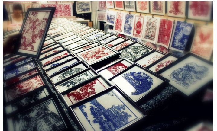
剪纸艺术