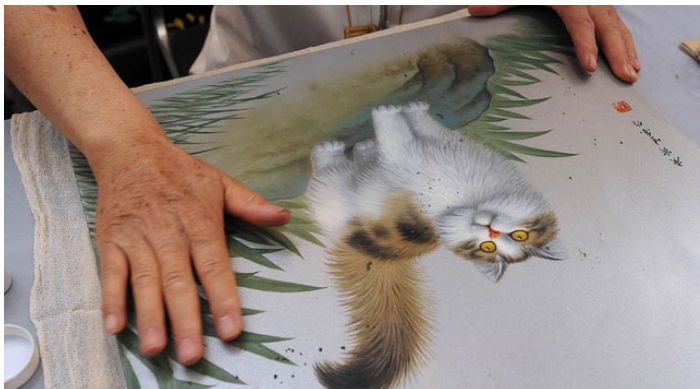
平遥推光漆器

永隆号是生产推光漆器的老字号，坐落在平遥古城内的南大街，在这里可以了解到平遥推光漆器的制作过程。