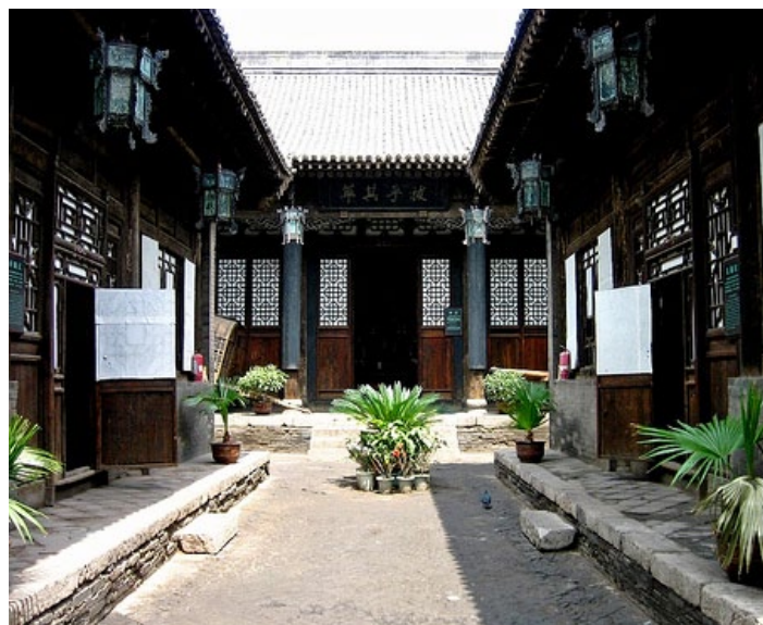
雷履泰故居

雷履泰，日升昌的首任掌柜，中国票号的创始人。始建于道光年间，距今已有 180 多年的历史了。