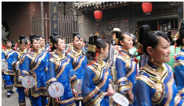
那会的女人