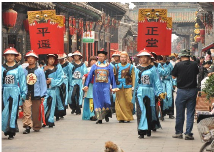
县太爷巡街

身着大褂的“县太爷”例行巡街，一路上游客络绎不绝，只要在平遥古城里转悠，你迟早能碰上一波，有时也会拉着游客参与表演。