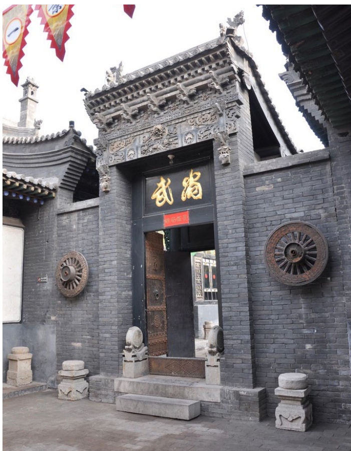
华北第一镖局

全馆总面积 1000 余平方米，分前、中、后、楼院四部分，开设 6 个展室和两个展厅，镖局介绍了清代中叶华北地区保镖行业 3 位杰出人物及资料。