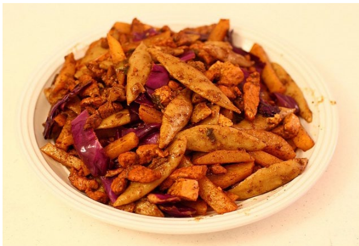
莜面鱼鱼

莜面搓鱼儿是山西雁北、晋中和吕梁山区人民常食的一种面食，因其做法是用手搓后，成为两头尖、中间粗的鱼状，故名搓鱼儿。