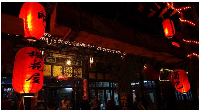
樱花酒吧

酒吧里有让人难忘的纯意式风味美食，也有纯正的平遥本地特色菜式；走进樱花屋，有一种让人沉醉的氛围。这里有很多外国人，晚上时不时还有表演。