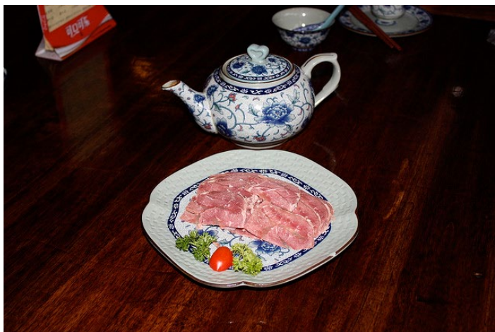
平遥牛肉

▲ 贴士：买正宗的平遥牛肉要注意：一定要买分部的；要买肉色粉红的，深红色说明打了催红素。