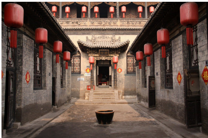
平遥乔家大院 门票：72 元 地址：山西省祁县乔家堡村 时间：春夏 8:30-18:30，秋冬 8:30-17:00

乔家大院原名“在中堂”，始建于清代，占地 8724.8 平方米，共分 6 个大院。四周外墙高达 10m 多，厚达 1m，从高空俯瞰，大院整体为双“喜”布局。