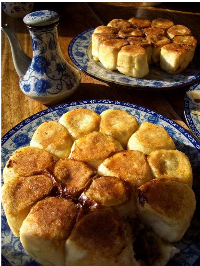
平遥水煎包

“水煎包”是平遥名吃之一，在当地人们简称它为“煎包”，其状扁圆，上下呈金黄色，外酥里鲜，口感甚佳，分为羊肉、猪肉、素菜水煎包多种口味。