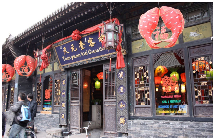
天元奎客栈

位于清明一条街中段，较有名气的四星级民居见饭馆，店内格局类似微缩的乔家大院，既有古韵之风又有小资情调，菜肴精致美观，量足，中西都有。价格稍贵，窗外适合拍照。