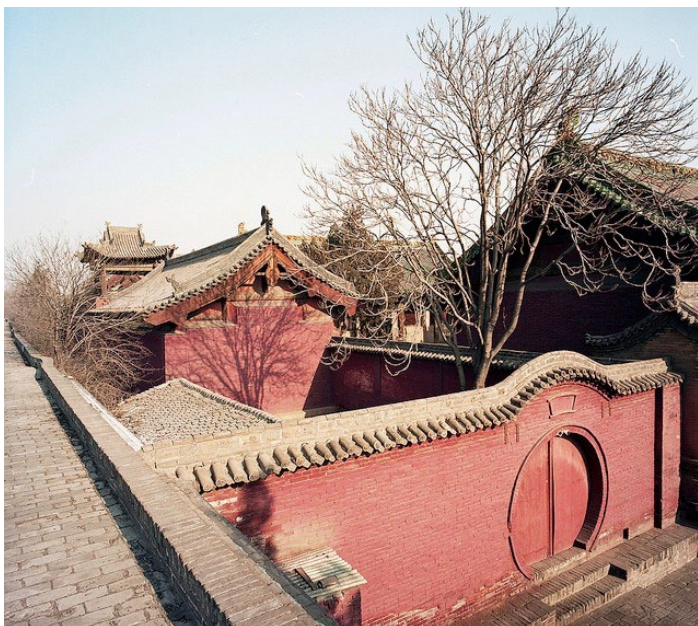
山西双林寺 门票：25 元 地址：山西省平遥县中都乡桥头村 时间：春夏 8:00-19:30，秋冬 8:00-18:00

双林寺其本地中都故城所在，原名“中都寺”，根据寺内现存最为古老的石碑推断，至少有 1400 多年了，素有“古代雕塑博物馆”之誉。外观如一座城堡是建筑。