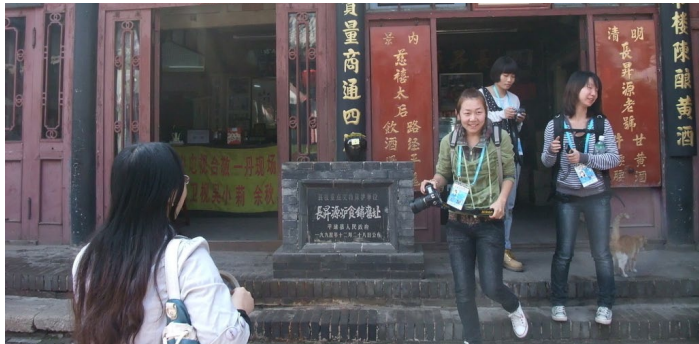
长升源炉食铺