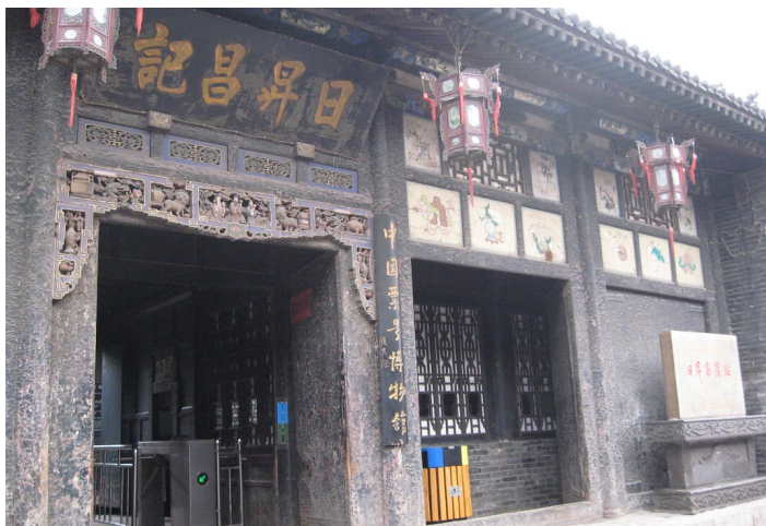
日升昌票号

中国第一家票号，座落于大清金融第一街—西大街。创始于清代1823年，由平遥西达蒲村李大全投资白银30万两和细窑村掌柜雷履泰共同创立，从此结束了中国镖局押送现银的落后形式。