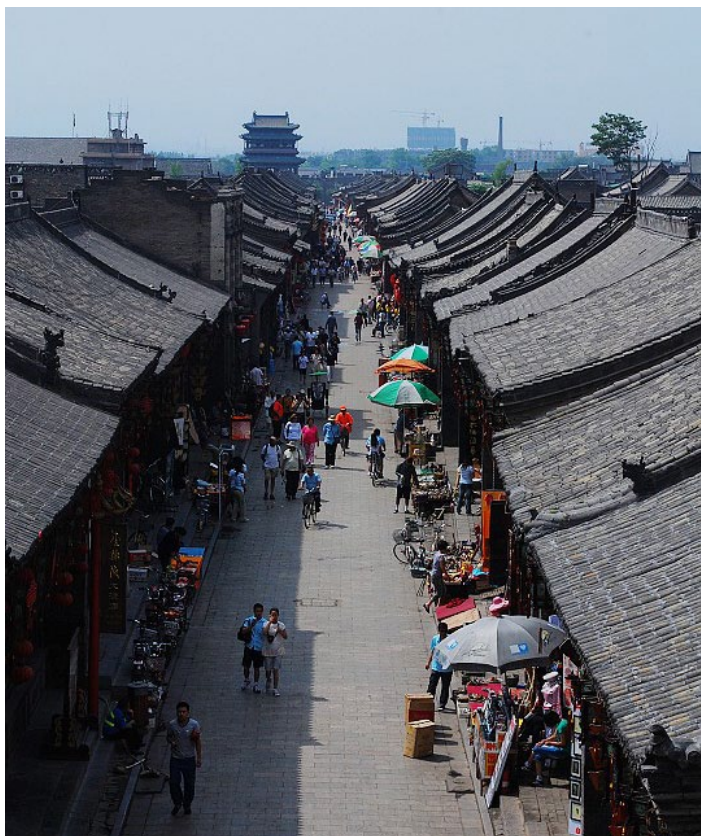
山西平遥古城

钱庄、当铺、药铺、肉铺、烟店、杂货铺、绸缎庄等等，几乎包容了当时商业的所有行当。