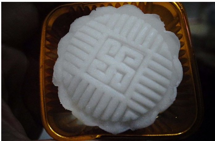
小时光手工月饼

手工月饼是平遥特色食品，一般来说用面粉、白糖、红糖、芝麻、花生仁等原料，以纯手工制作而成。大的两元，小的一元。