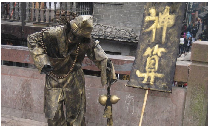
行为艺术 duoduoyun 摄

走在古城南大街上，你会不时发现，身边多了两位身着古铜色仿古服装，手拿算盘、菩提扇的表演者等等，大家可以通过他们的表演更形象地了解古城深厚的文化。