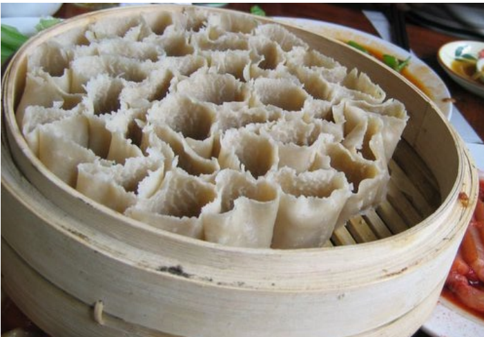
山西面食 - 莜面栲栳

莜 yóu 面 栲 kǎo 栳 lǎo 栳 lǎo: 本是忻州地区的一种特色面食小吃，渐渐成为整个山西地区的特色食物之一。用莜面精工细作的一种面食，其得名是由于形状像“笆斗”，民间叫“栲栳”。