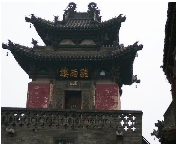
听雨楼 1 地址：山西省晋中市平遥县政府街 门票：5 元