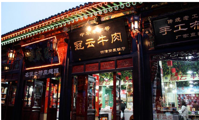
冠云牛肉