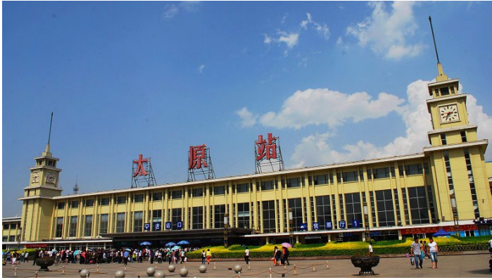
太原火车站