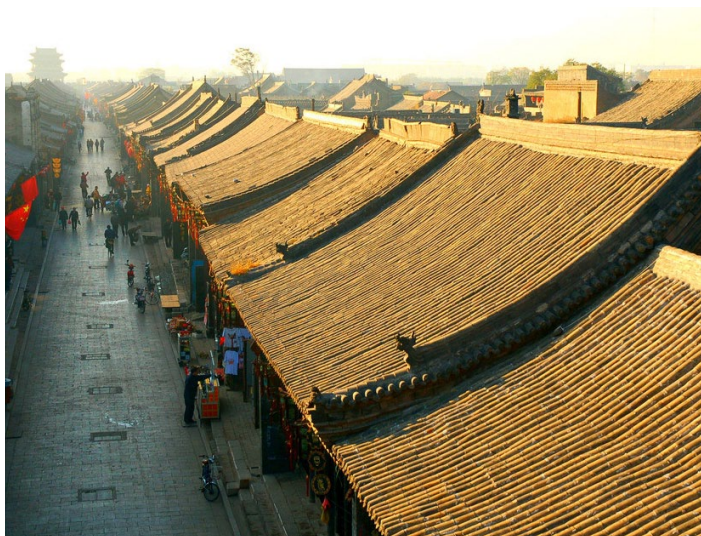
平遥古城

9-11 月温凉宜人，适合出游，9 月底还会举行摄影节，场面火热。冬季虽然寒冷，游人较少，还能欣赏到民间社火表演和白雪下的古城美景，春节年味十足，活动丰富，乐趣不少。