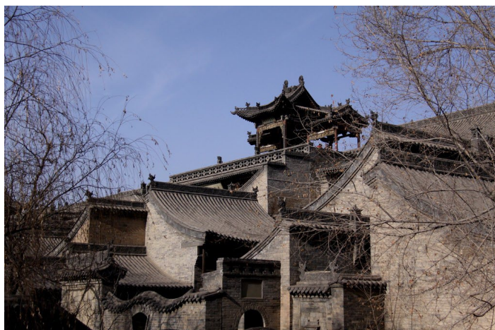
平遥王家大院 门票：66 元 地址：山西省灵石县静升镇 时间：夏季 8:00-19:00，冬季 8:00-18:00

王家大院由历史上灵石县四大家族之一的太原王氏后裔 - 静升王家于清康熙、雍正、乾隆、嘉庆年间先后建成。其中，五座古堡的院落布局分别被喻为“龙”、“凤”、“龟”、“麟”、“虎”五瑞兽造型，总面积达 25 万平方米以上。