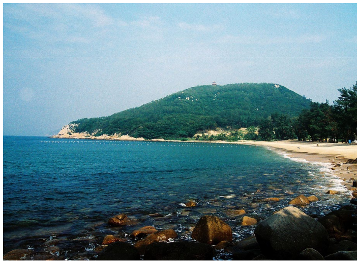
珠海东澳岛

东澳岛碧海蓝天，渔村炊烟袅袅，岛上的南沙湾有“钻石沙滩”的美名； 外伶仃岛上遍布奇石，上岛可以垂钓、滑浪，是充满野趣的旅游度假地； 九洲岛上山光水色，茂林修竹，环岛漫步，忘却尘世的喧嚣与繁杂； 淇澳岛风光旖旎，古迹众多； 还有许多不知名的小岛像珍珠一样散布在海面上。众多小岛风光旖旎，海水洁净，既可充分享受冲浪、潜水、水上降落伞等活动；又可静静享受垂钓乐趣。在东澳岛、桂山岛等小岛上，游客还可随渔船一道出海撒网捕鱼。