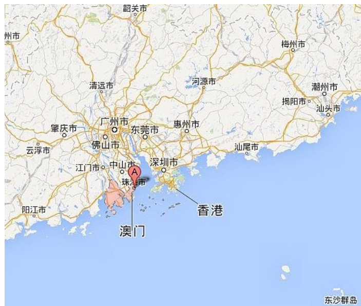
珠海的夜，珠海的云。

但 6-10 月会有台风，以及由此导致的暴雨，此阶段出行的话，要注意提前关注相关信息，避免台风期出行。