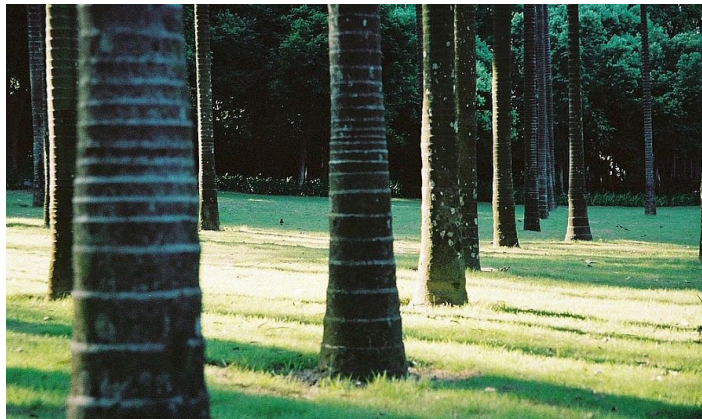
珠海海滨公园

海滨公园位于海滨南路与香炉湾之间，北起犀牛望月山，南至海景路，东至菱角咀，南距澳门 5km。珠海的标志“珠海渔女”雕塑就竖立在海滨公园的岩石上。海滨公园内林荫夹道，环境幽静，山景、海景浑然一体。