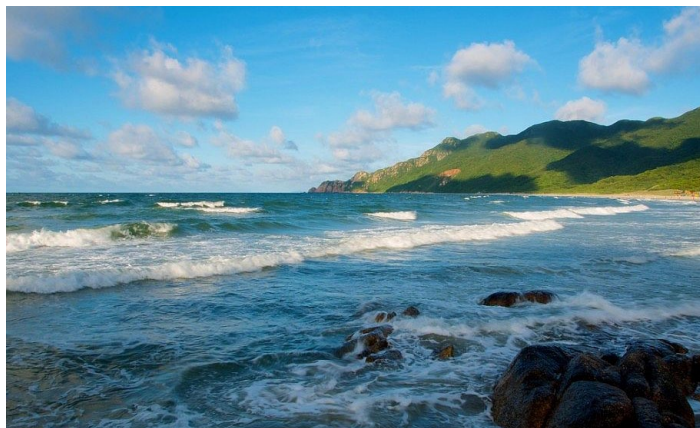
荷包岛 8876 Koon 摄

荷包岛是珠海市 146 个海岛中沙滩最多的海岛。景色十分秀美，除有海浪、森林、山泉、灵龟石、蝴蝶谷和奇花异草这些自然景观，沙质柔软的“十里银滩”，南海前哨的明碉暗堡、战壕和渔村等也都可供游客参观游览，更有海上垂钓、篝火晚会等各种海上娱乐活动。