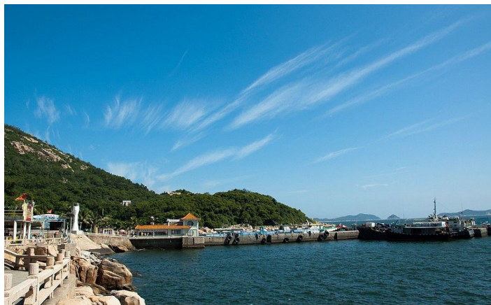
外伶仃岛 - 海岸 3

外伶仃岛在星罗棋布的万山群岛中风格独特，岛不大而绮丽，山不高而峻秀，尤以水清石奇为人称道。岛上伶仃湾、塔湾、大东湾的沙滩沙质细腻，海水湛蓝，清澈见底，是垂钓，游泳，冲浪的好去处。