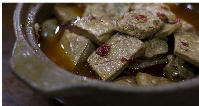
五香豆干

“秦淮八绝”，指南京八家小吃馆的十六道名点：比如魁光阁的五香茶叶蛋、五香豆；奇芳阁的鸭油酥烧饼、麻油干丝；六凤居的葱油饼、豆腐脑儿；蒋有记的牛肉锅贴、牛肉汤；莲湖糕团店的五色小糕、桂花夹心小元宵等。