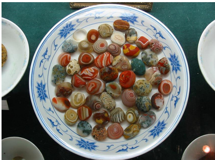
Samuel Tao 摄