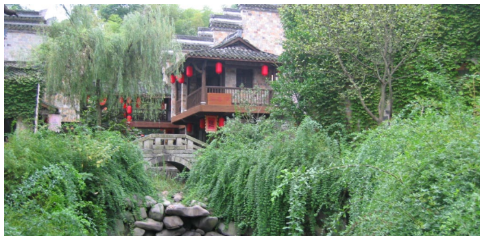
红灯笼外婆家

红灯笼乡村家园位于桐庐天目溪漂流景区内，这是一处具有田园乐趣和乡村风情的休闲度假旅游区。由红灯笼小木屋度假村、观光农艺园、红灯笼外婆家组成。