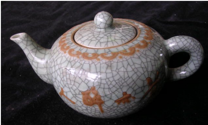
仿南宋官窑

南宋官窑位于杭州凤凰山下，专为南宋皇室烧制瓷品。南宋官窑青瓷的特征是薄胎厚釉，紫口铁足，釉面开片，完美的造型和“雨过天青”的釉色给人以视觉上的美感。爱瓷之人不愿看到南宋官窑的落寞，希望昔日的“堂前燕”也能飞进百姓之家，于是仿制的南宋官窑便应运而生。