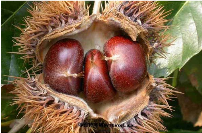
百江板栗

浙江百江镇位于桐庐县西南部，百江镇因地制宜，利用低丘缓坡大力发展板栗生产。所产板栗品质好、颗粒大、产量高、味道甜美、营养丰富。