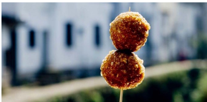
孙权面筋

孙权面筋是龙门传统菜，是龙门古镇的特色小吃，据说当年孙权得胜归来，用油面筋犒劳将士，于是这种象征胜利的食品也在古镇代代相传。