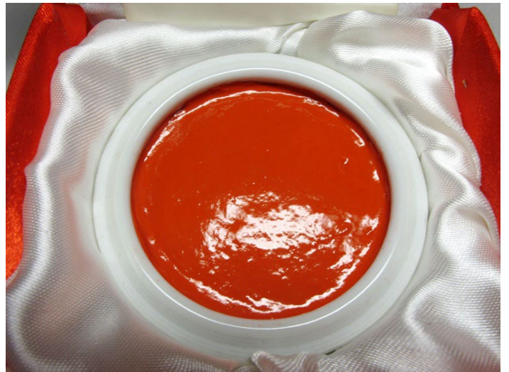
西泠印泥

印泥是传达印章艺术的媒介物，质量优劣，直接影响到印章艺术表达的效果。质地好的印泥，铃印出来则色彩鲜美而沉着，有立体感，显得有精神。刘老手工制作出的印泥色泽朱红，鲜艳夺目，细腻浓厚；冬天不凝固，夏天不走油，印迹清晰，永不褪色。即便是在开水中浸泡或者在火上烤，这个印记依然很清晰。