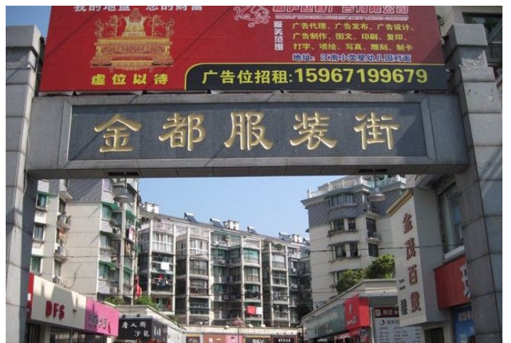
金都服装街