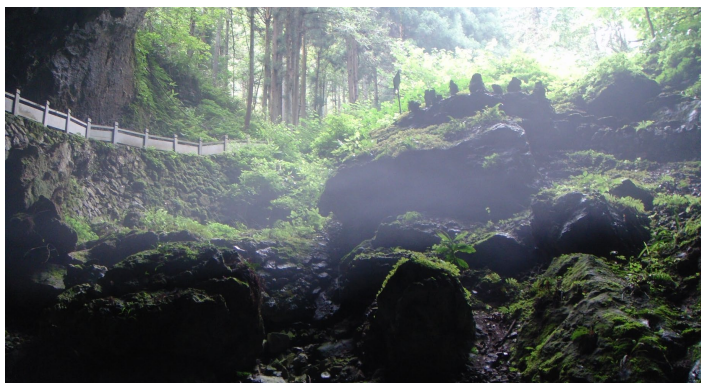
桐庐溶洞

游览桐庐的最佳时间是春秋季节。桐庐四季分明，夏炎冬寒。桐庐景点多山水，盛夏游湖无荫可庇，容易暴晒，爬山辛劳，冬季则无法亲水，所以选择气候最宜人的春秋季节前往是最好不过的。