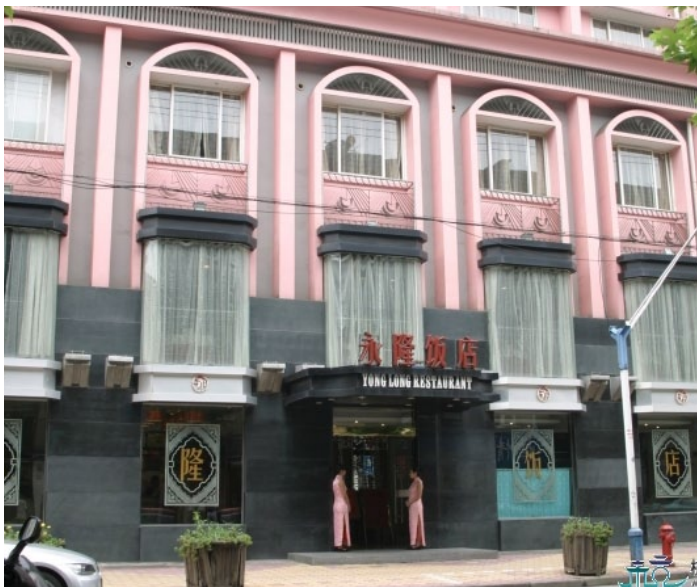
永隆饭店

荣获“国内旅游定点单位”和“餐饮名店”等称号的纯餐饮酒店，创办于1989年，堪称桐庐餐饮业中的“老字号”。