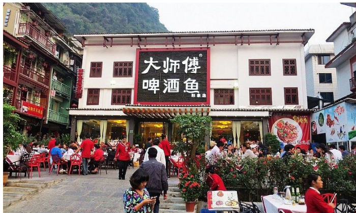
大师傅啤酒鱼

位于漓江边的唐人街大酒店旁边，可以吃一边饭一边看江景，而且服务质量也很好。最重要的是鱼很好吃，色香味俱全，值得一试。