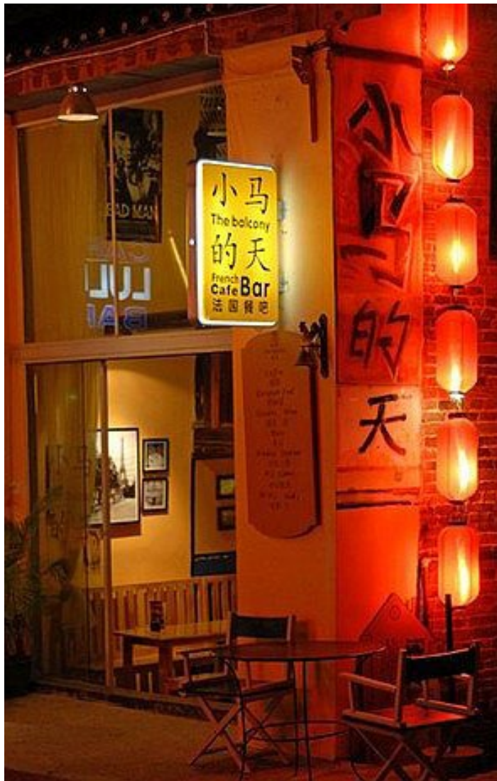
小马的天

露台架空在小河上，紧挨着小桥边，很特别，室内装修很有艺术感，有西餐供应，食物也很精致，推荐巧克力蛋糕、法式早餐等，非常丰盛，到了晚上是静吧，从来不少人气，却不烦人，可以对着小桥流水静静地想心事儿。