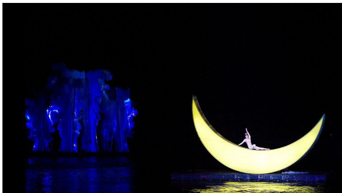
印象刘三姐

2. 如遇暴雨涨水等自然不可抗拒原因，可能会取消当日的演出，所订票由出票单位按实付金额退还。