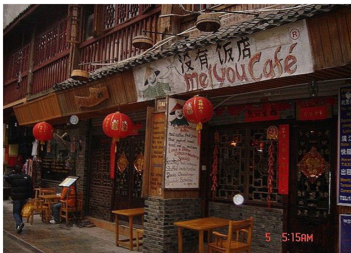
阳朔西街的没有饭店

环境清幽，是西街很有名的一家店，餐桌上铺的是本地的特色蜡染桌布，中式的民族风与西式餐厅的结合有很特别的味道。