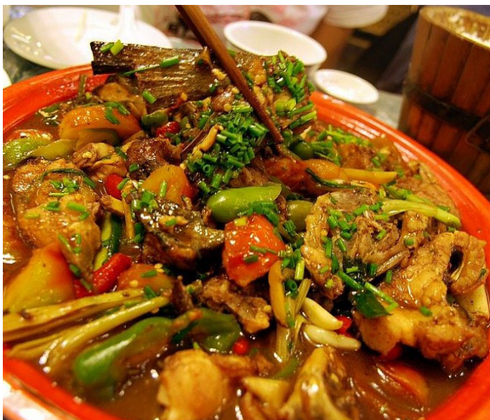
谢大姐啤酒鱼

啤酒鱼是阳朔最有名的地方菜。挑选新鲜的漓江鱼杀好，不刮鳞，两面都炸成灿烂的金黄色，然后用啤酒焖烧，以酱油、辣椒、木耳和番茄等佐味，加盖焖至入味。肉质细嫩，辣味和鲜味完美结合，细品时还有一点回甘。