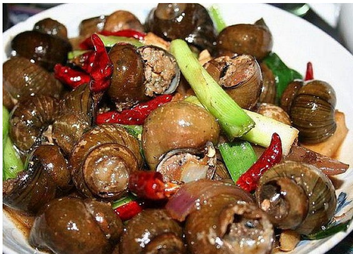
西街的田螺酿