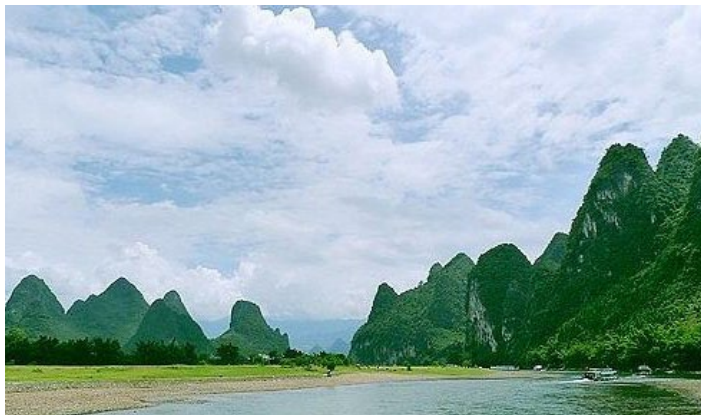
阳朔 - 漓江 -01 十七摄

桂林汽车站或火车站广场，乘桂林至阳朔的班车（为班车，每10分钟/班），在杨堤路口下车，约1-1.5小时，车费约10-20元/人；再在路口换乘从阳朔至杨堤码头的小巴，约10分钟即到，车费约3元/人。