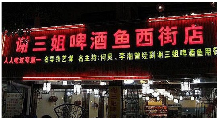
33 西街 - 谢三姐啤酒鱼

当地人气很旺的店，门口还打着很大的宣传广告，张艺谋等很多明星去过的店，味道不错，啤酒鱼价格偏贵，其他菜都还算适中，很多游客都慕名前来品尝。