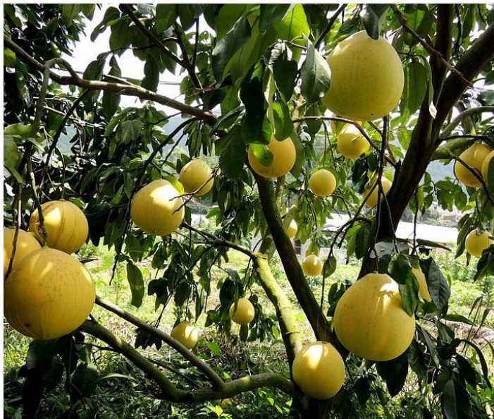
Pomelo tree 沙田柚

因原产地在广西容县沙田乡而名，后来渐渐引种至桂林、柳州等地。沙田柚果体大小适中，底部中间微凹，有一圈圆形凸起的印环，味甜如蜜，果汁充足，营养丰富，有“天然罐头”的美称。