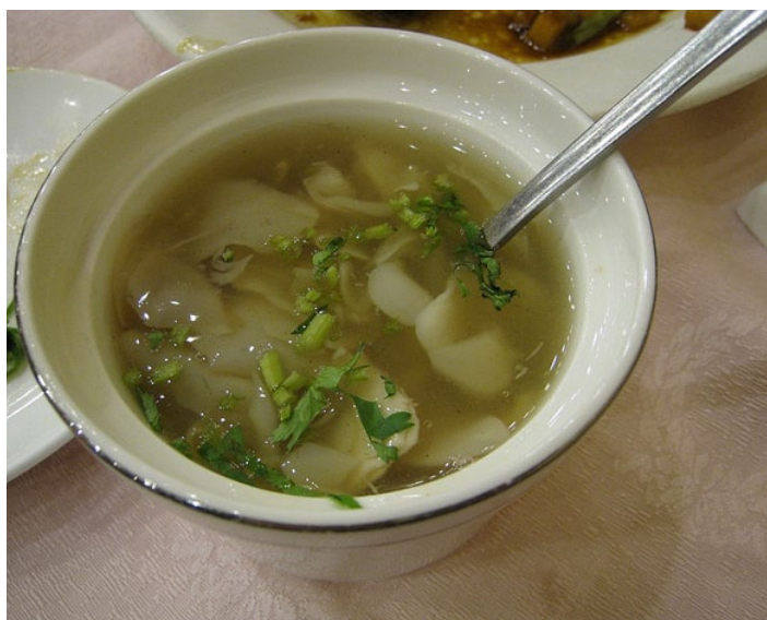
酸辣乌蛋汤

乌鱼蛋为日照市独有的海珍品，历史悠久，驰名中外，相传为封建帝王御膳佳品。酸辣乌蛋汤用鲜乌鱼片、特制醋、清汤制成，不仅口味上感觉酸辣鲜美，而且还具有开胃的功效。