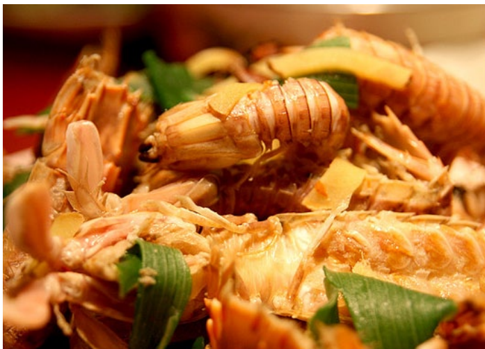
海货 echodan 摄

产自两城镇的虾皮和西施舌，生长海域在黄海入海口的白马河口与两城河之间的海州湾，环境优良、饵料丰富，是虾、蟹、贝类等繁衍生息的绝佳场所。