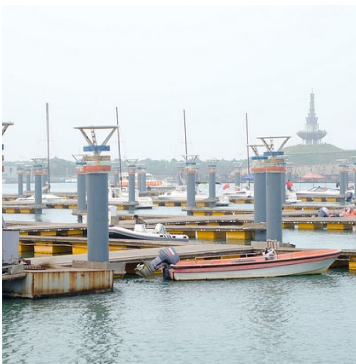
万平口海滨风景区

泻湖曾是一片平静美丽的内海，现已被当地渔民改造成养鱼池。风景区内的生态公园是景区的中心区域，景区突出生态和海洋的主题，融入了人与自然和谐共处的理念，是日照“海滨生态市、东方太阳城”的重要标志。