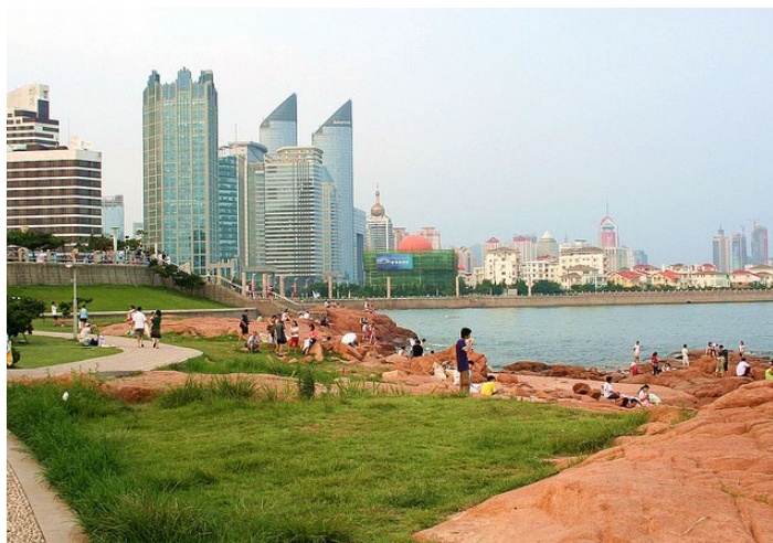
第三海水浴场

第三海水浴场也叫山海天浴场，紧邻王家皂民俗旅游度假区，是个游客比较多的海水浴场。第三浴场是不要门票的，这里浪比较平稳，海水清澈，沙质也不错。