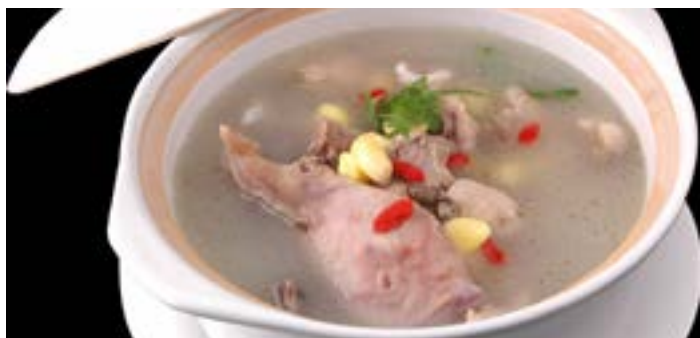
白果炖老鸭

作为广西桂林的一道名汤，白果炖老鸭巧妙地去除了鸭子本身的鸭骚味，对于不爱吃鸭子的人是一个很好的选择。白果清热解毒，老鸭滋阴养颜，一道白果炖老鸭堪称上好补品。汤品清淡，味道鲜醇，四季皆宜。