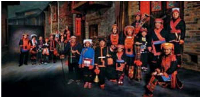
盛装的瑶族百姓

传说远古时，风神发怒，村寨受灾。有神仙指点众人，正月二十日禁声禁风，祭祀风神，果然灵验，这一天便成了禁风节。节日期间禁止一切声音，连晾衣服也只能铺在草地上，全寨人都离家到庙坪圩去过节。