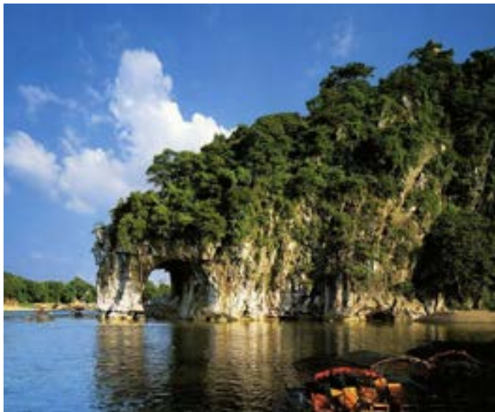
桂林象山公园

象山公园, 在市中心的漓江与桃花江汇流处, 以象鼻山——桂林市市徽为主体。因整个山形酷似一头驻足漓江边临流饮水的大象而得名, 简称象鼻山。可以选择从不同方位、角度观看象鼻山不同的美态。而象鼻山的夜景也是别有一番特点。