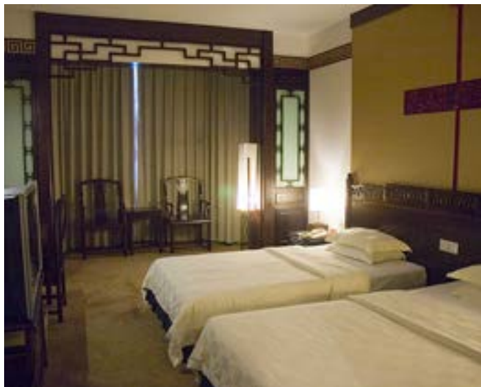
酒店标准间

酒店旁边就是两江四湖景观带，离西城路小吃步行街也很近。为四星宾馆，但因为老店，所以略微陈旧。