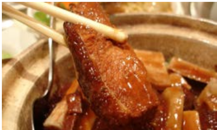
荔浦芋扣肉

荔浦芋肉质细腻，肥瘦相宜，具有特殊风味。用荔浦芋和五花猪肉做成扣肉，历来成为逢年过节家宴或红白喜事和宾馆酒楼席上的一道名菜。