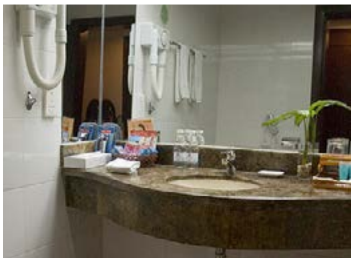
酒店卫生间

该酒店一出门就是象山的边门，出门左走两分钟就是杉湖和金塔，对旅游的人来说，地理位置很好。