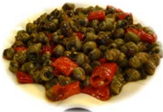
桂林田螺 Ewoker 摄

桂林田螺是一道夜市餐厅都能吃到的特色地方美味。田螺多生活在水田池塘，个大肥美。吃时，挑开螺的顶盖，用力喝完田螺再挑出里面的田螺肉，味道鲜辣爽口，特别开胃，配合啤酒一同食用尤佳。