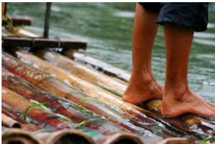
遇龙河漂流

喜欢水上运动的人一定不要错过阳朔的漂流，尤其在夏天时，刺激的漂亮会给闲适的桂林之旅增添一份不一样的感受。阳朔目前有三个正规漂流，龙颈河漂流河九马画山漂流相对比较刺激，遇龙河漂流则属于观光类型，老少咸宜。