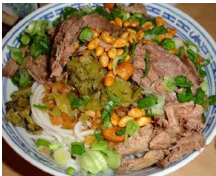
桂林米粉

位于中山北路，一条通往木龙湖的美食街。这条小街巷里烧烤，米粉、火锅，有差，煎米糕，牛血……一应俱全，不过位置相对有些偏僻。