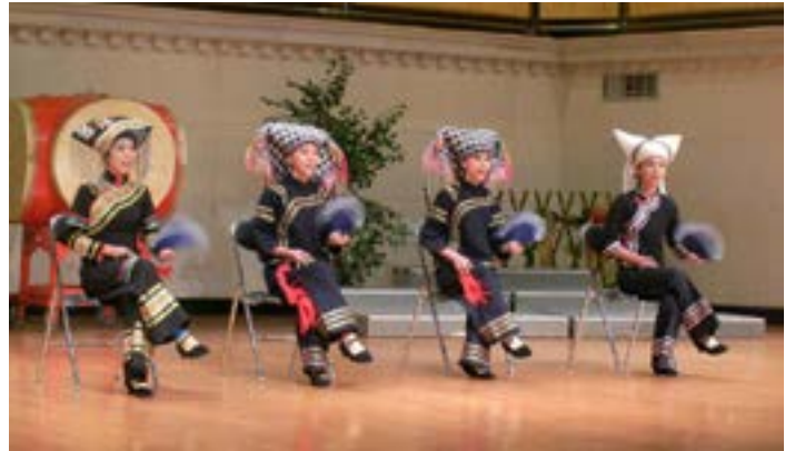
壮族末伦调《安家歌》

又叫“歌圩节”、“歌节”，分日歌圩和夜歌圩。日歌圩在野外，以倚歌择配为主要内容。夜歌圩在村子里，主唱生产歌、季节歌、盘歌和历史歌。