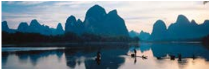
桂林山水

每年 4-10 月桂林山青水秀，是游山玩水的最佳时节。夏季可以体验刺激的漂流，农历四月十五之后的半个月，水汪汪的龙脊梯田又是另一番奇景。中秋之夜的象鼻山“漓江双月”更是美轮美奂。