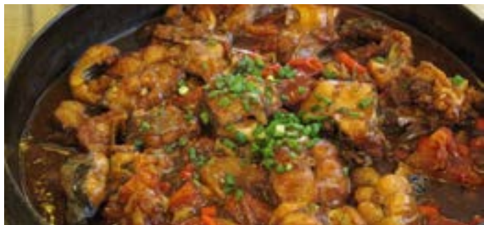
大师傅啤酒鱼 Wenyi Y 摄

去阳朔玩自然要吃啤酒鱼，不过其中并没有丁点鱼腥和啤酒的苦味。而想煮处正宗的啤酒鱼也就两点诀窍，一是要在阳朔煮，二是要漓江水的活鲤鱼。所以想吃到正宗的啤酒鱼，还是需要亲自去阳朔体会。