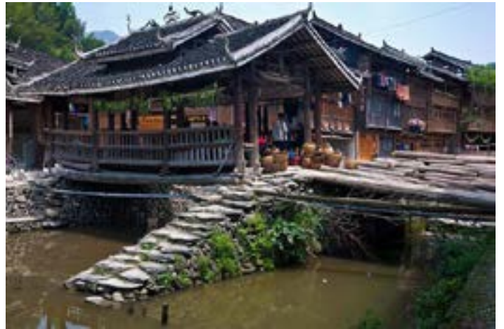
侗族风雨桥