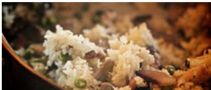
豆蓉糯米饭

豆蓉糯米饭是桂林人早餐桌上常见的小吃。将上好糯米蒸熟做成饭团，以甜豆蓉为主馅，再拌以炒香的芝麻、葱花。当然如果相对于甜食更偏爱咸味，还有加以香肠、煮牛肉等为馅的咸糯米饭，亦别有风味。