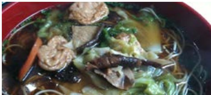
尼姑素面

尼姑面即素面。桂林的尼姑面历来已久，和桂林米粉并未姐妹小吃。尼姑面的汤与米粉的汤不同，不过共同点都是让人唇齿留香。面上铺一层草菇、素火腿、面筋等素菜，滴几滴香油，配以花生米、胡椒等，其味更鲜美甜爽，清香四溢。