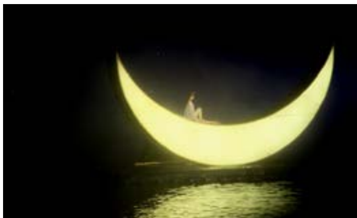
印象刘三姐

《印象·刘三姐》是由张艺谋导演，全国第一部全新概念的桂林山水实景演出。利用环境艺术灯光及烟雾效果，创造出如诗如梦的视觉效果。淋漓精致得体现桂林自古以来的幽美神秘和豪华气派。是去阳朔不能错过的一次体验。