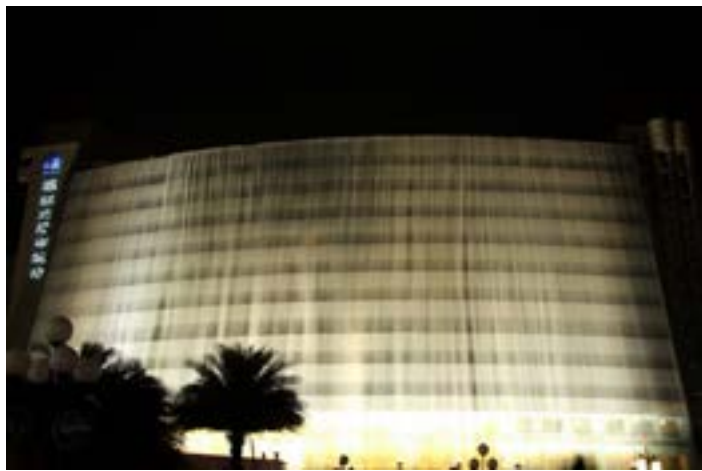
漓江大瀑布酒店

酒店就处于桂林市中心，离市中景点很近。并且，每晚 8:30，瀑布会从酒店顶端倾泻而下，是桂林一大夜景，已列入了大世界吉尼斯纪录。