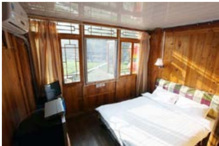
大瑶寨客房 BossMun 摄