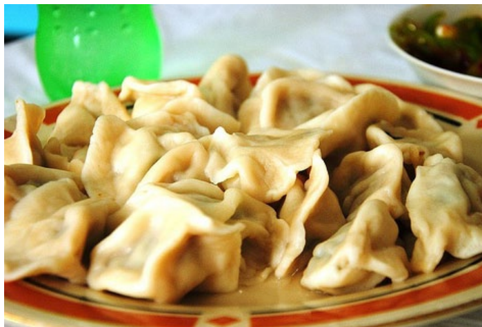
鲅鱼水饺

鲅鱼饺子在胶东一带很有名气，因鲅鱼鲜嫩，富含蛋白质、维生素等营养元素，更深得当地人喜爱。做为饺子馅料儿的鲅鱼肉质更鲜美，无需加其他多余的调料，和入少许姜葱、韭菜，也有喜欢加个鸡蛋的，更显得香滑入口。