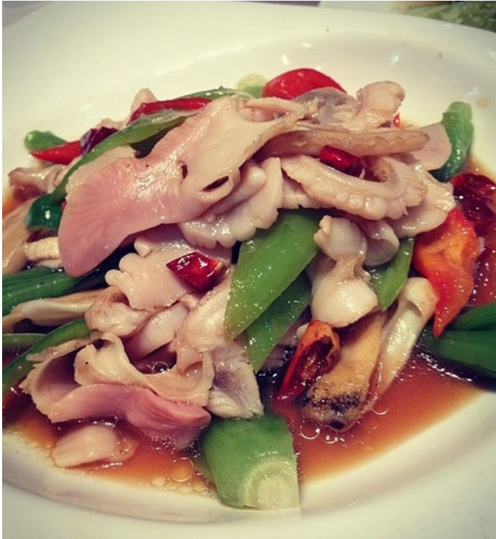
美极天鹅蛋