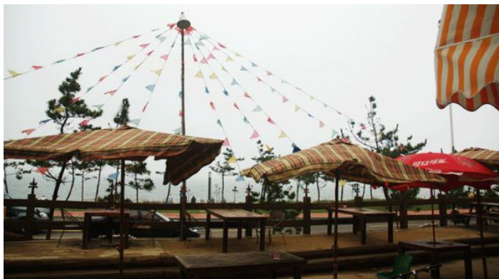
威海自由左岸青年旅舍