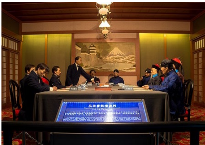
中日甲午战争纪念馆