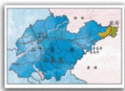
威海在山东的位置