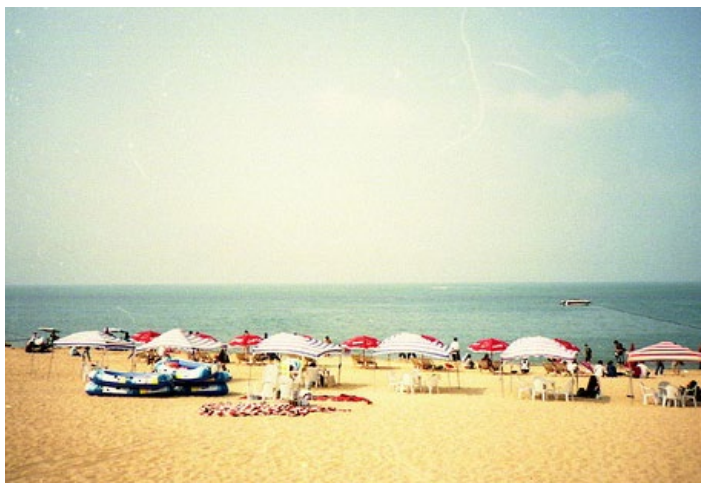
威海国际海水浴场

是一个天然海水浴场，四季分明，冬暖夏凉，有万亩松林带环绕、浴场沙质柔细，海水清澈，滩坡平缓，点缀于海岸边的花草、石雕、五色彩棚，更显风光绮丽，构成了一幅山、海、林、人于一体的美丽图画。