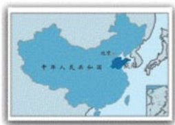
山东在中国的位置