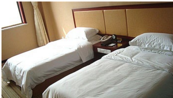
威海海日大酒店标准间

威海海日大酒店是一所集餐饮、客房、休闲、商务会谈与一体的多功能酒店。地理位置优越，地处于城市南中心—经济技术开发区，购物、出行便捷。