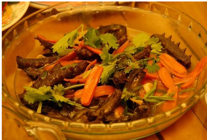
红烧海参

海参本就营养丰富，是威海海鲜中至上至美的佳品，以红烧烹饪更显得滋味细腻，较适合好咸鲜口感的人。海参还有滋阴补肾，增强机体免疫的功效。