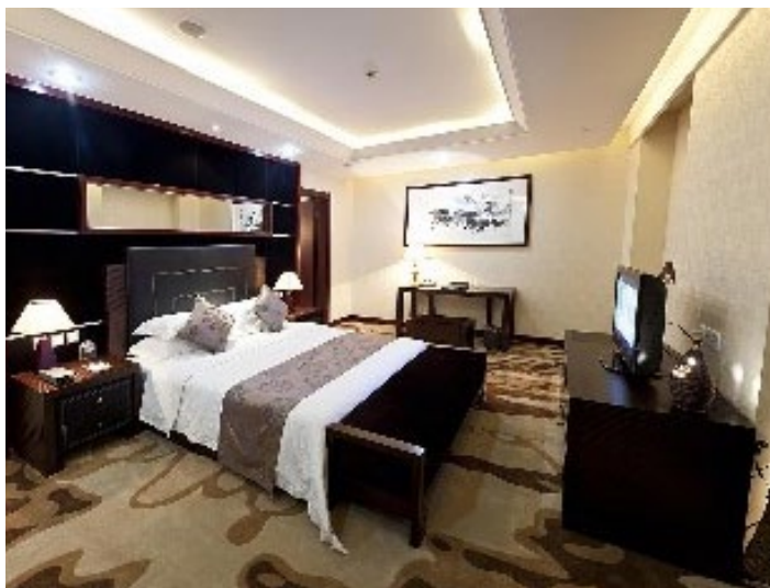
威海铂丽斯国际大酒店

威海铂丽斯国际大酒店是一家集住宿、餐饮、娱乐、商务、会议于一体的高档旅游涉外酒店，整座大厦是威海市的标志性建筑之一。威海铂丽斯国际大酒店交通便利，地理位置十分优越，是商务出差、旅游度假的理想选择。