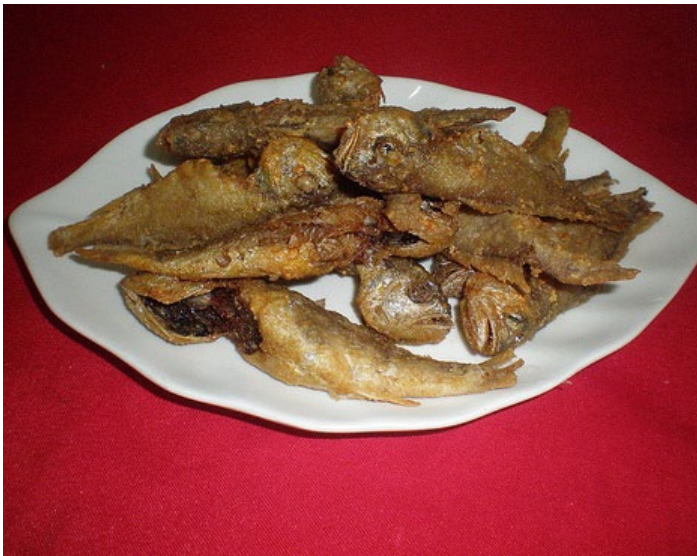
干炸小黄鱼

小黄鱼是威海的著名特产，将小黄鱼洗净，放入调料，腌制两小时左右，再把干面粉放入盆中，逐个下入裹上面粉的小黄鱼炸至金黄色去处，当油温升至八成热再复炸一遍，使之焦脆的即可。此菜外酥里脆，味道鲜美。