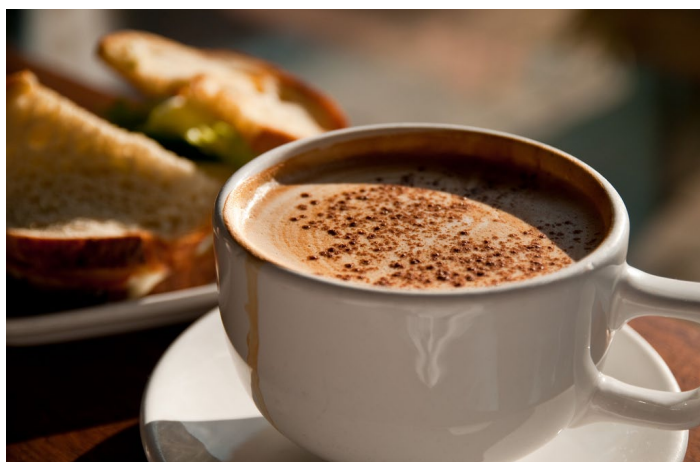
Urban Coffee Lounge