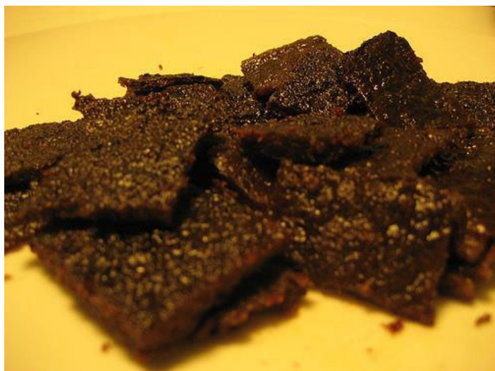
Wennie not the phoo 摄