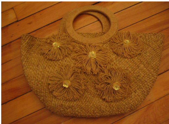
地址：路易港

来毛里求斯千万不要错过首都路易港的东方市场，这里物品众多，价廉物美，极具地方特色。草织篮子是市集的一大特色，鲜艳夺目，林林总总，价钱介于五至二十新元。