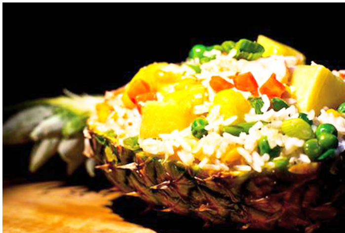
@ Ruoaald 菠萝饭

菠萝饭又叫凤梨饭，营养全面，富含维生素及蛋白质，奇香的泰国香米，搭配菠萝以及什锦蔬菜，用大火爆炒，酸甜偏咸的口感，吃一口就令人食欲大开，加上酥脆的腰果，入口之后层次丰富，回味无穷。