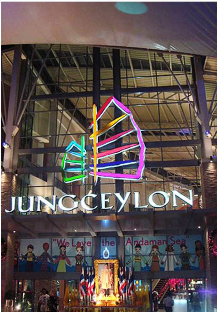
@ MylifeStory Jungceylon