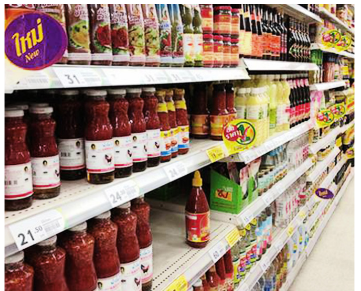
@ SamanlIna_Bell 易初莲花

小巴：Big C Super Center - Phuket Community College (Sapanhin)