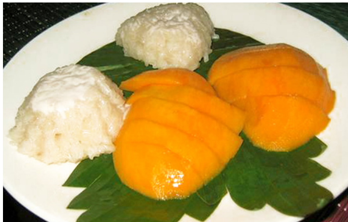
@ fomer_gabel 芒果糯米饭