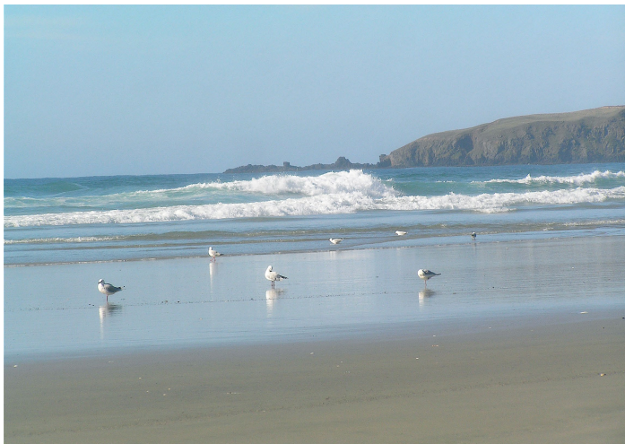
胜利海滩

胜利海滩是西哈努克看日落最好的地方，海滩上还能吃到各种中式或高棉的特色美食，吸引不少背包客在这里住宿。