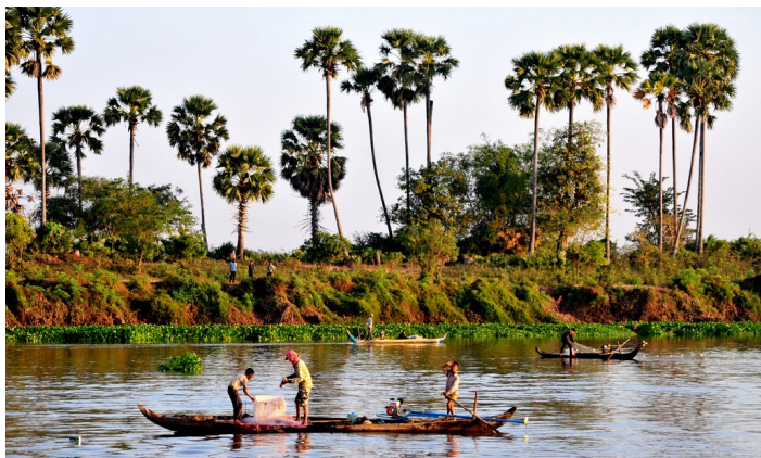
洞里萨河

洞里萨河算是金边风景最好的地段了，河岸变还有不少旅馆酒吧，无论是沿着河岸散步还是坐在露天吧台上品尝当地特色美食都是一种享受。