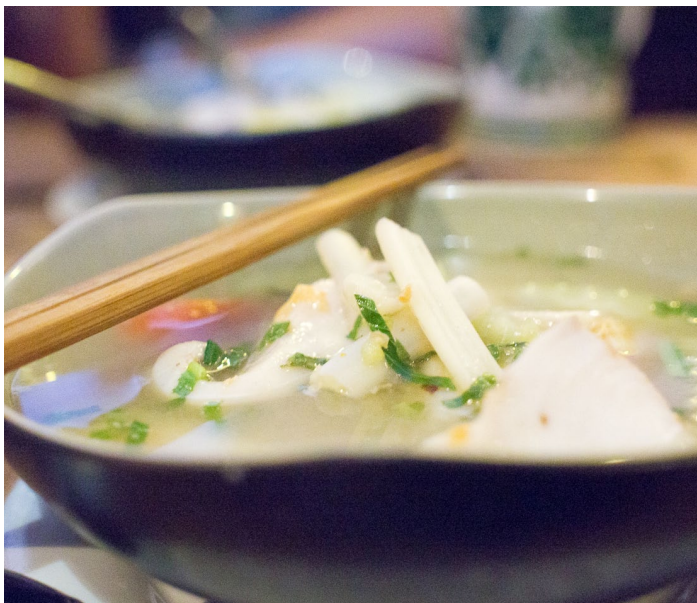
柬式酸汤

柬式酸汤就是将各种肉类与蔬菜混合，因为柬埔寨饮食偏酸辣，所以汤底里面会有酸菜、柠檬汁、鱼露、醋辣椒，整道菜的口味偏重，不过，在大夏天的时候喝一口酸酸的汤水，还是很开胃的。