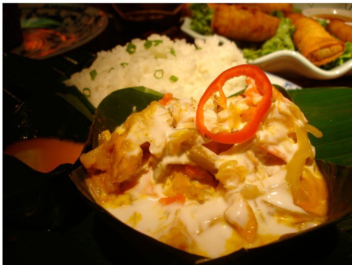
Amok weye 摄

AMOK 在柬埔寨几乎家家餐厅都能吃到，这道当家菜也确实很好吃。椰奶味道很重，味道层次多，搭配鱼肉，味道非常好吃。另外，如果喜欢的话还能够在机场买到 AMOK 的调料。