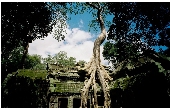
达波龙寺

达波龙寺的顶端、基底和夹缝中生长着许多数百年的参天古树，这座与自然相结合的建筑，也是吴哥建筑中极具特色的景点之一。这种人与自然相碰撞出来的结果，已成了游客们感叹的奇观。