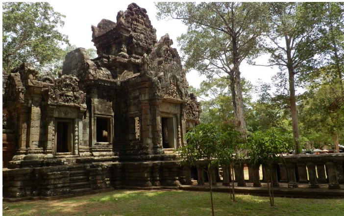
周萨神殿

周萨神殿是由砂岩和火山岩建造，由中央圣殿和两侧的藏经阁及四周围墙构成。神殿曾遭受天灾战乱的破坏，不过，于2000年开始的修复工作是周萨神殿渐渐恢复了往日的样貌。如今的周萨神殿修复工程已经结束，游客们还是能从中感受昔日的风采。