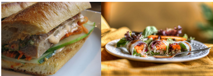
柬式三明治 柬式蔬菜春卷

蔬菜春卷就是春卷中生菜、黄瓜、豇豆、罗勒等一大堆蔬菜混合物，而且，蔬菜春卷还配上一小碗蘸酱。