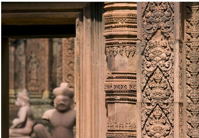
吴哥女王宫

女王宫的建筑规模虽然不大，但是里面各种女子的雕像美轮美奂，而且保存完整。女王宫的浮雕艺术在整个吴哥文明中首屈一指，被誉为吴哥建筑群中不可多得的艺术珍品。