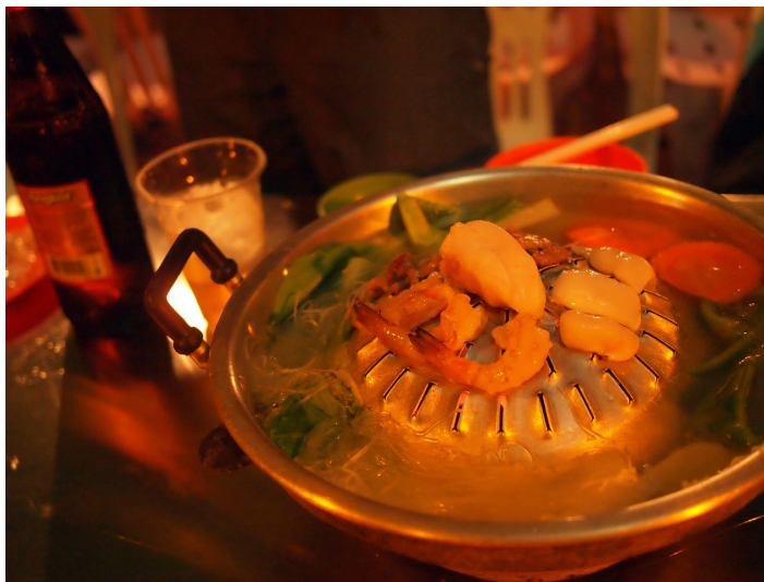
柬式火锅

来柬埔寨就不能错过柬国的火锅，火锅的分量很足，而且价格实惠。传统的柬式火锅使用陶瓷锅，汤底配有香料和药材，口感清甜，越煮越鲜。样子有点类似中国的小火锅。