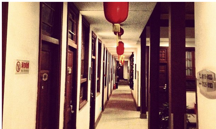
汉庭走廊