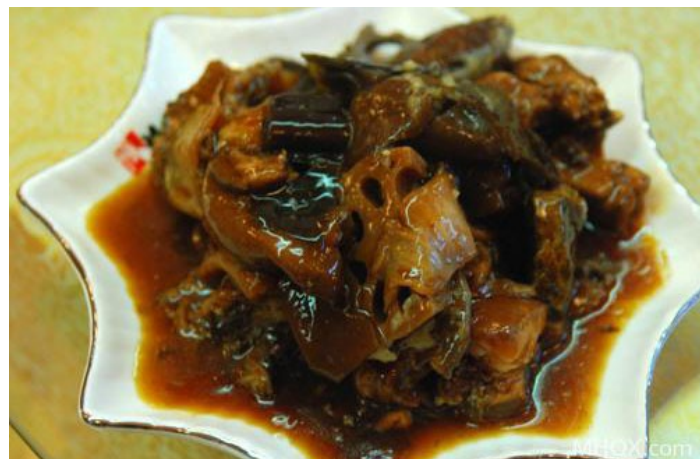
博山酥锅

是博山传统小吃。春节期间，家家户户制作酥锅来招待亲朋。随着时间的演变，酥锅已由家庭菜肴发展成为各大饭店、餐馆的人气佳肴。