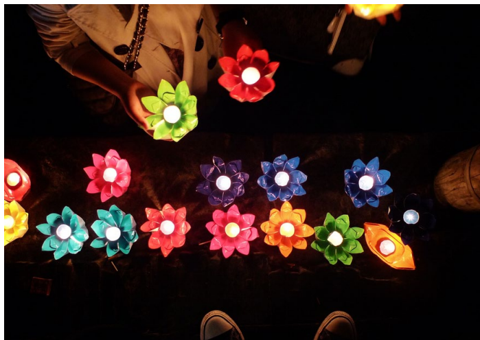
马踏湖放荷灯

碧水环绕，阡陌纵横，素有“北国水乡”之美誉。环境幽静，泛舟湖上再品尝农家饭菜令人心旷神怡。