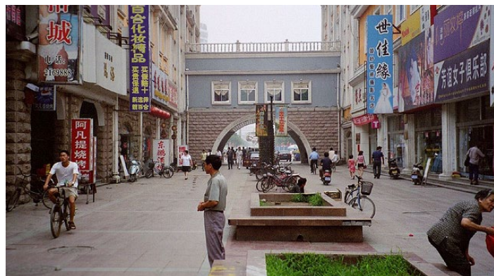
piaget man 摄

看过了充满历史韵味的淄博，想购买现代的东西就要去张店区步行街了，步行街到了晚上非常热闹繁华，展现了淄博年轻现代的一面。