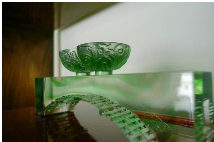
琉璃制品