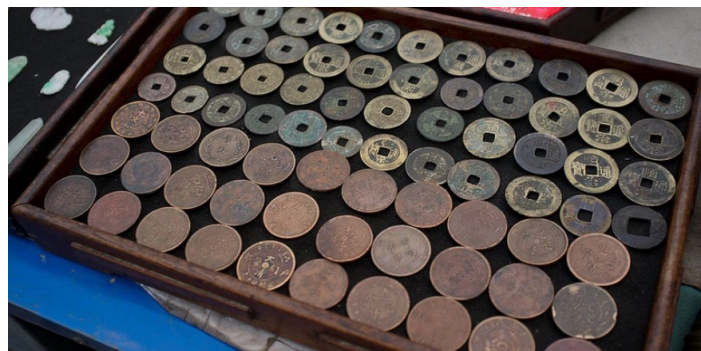
古玩 Eason Q 摄