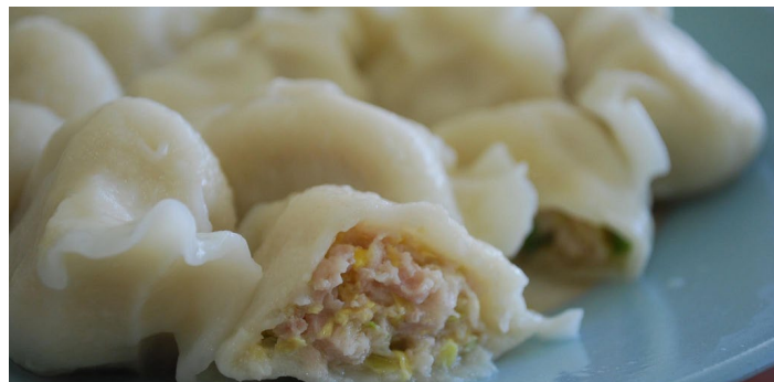
石蛤蟆水饺

淄博老字号的饭店，特色菜都不错，可以尝尝，豆腐箱很不错，略微有些油。水饺很不错，各种口味都有，且可以自由组要。