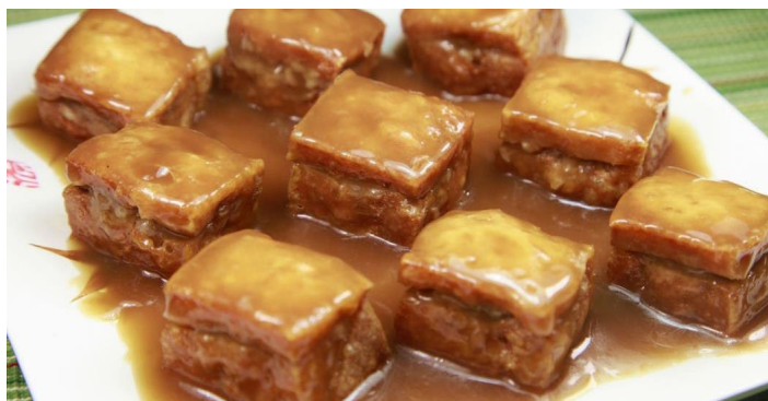
博山豆腐箱 小捷的厨房 摄

博山豆腐箱是淄博的传统菜色，传说乾隆曾对它赞不绝口。其味清香，软嫩适口，是道色香味俱全的名菜。