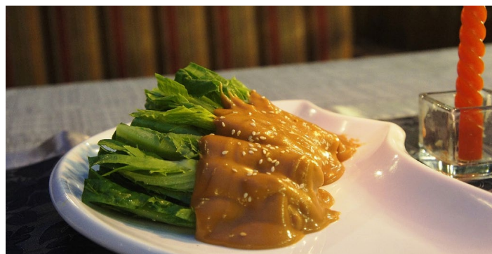
麻酱油麦菜

淄博比较有代表性的酒店，比较上档次，价格中高档。环境，服务都不错。羊肉最为正宗，香嫩顺滑，蘸料是秘方，非常诱人。