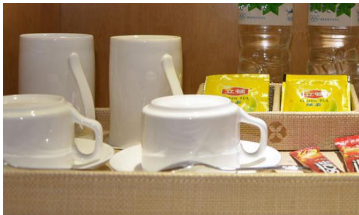
酒店一角