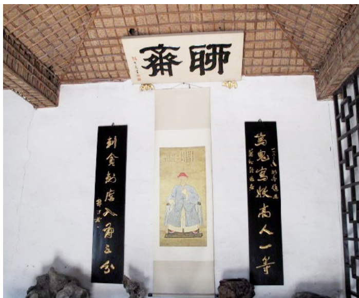
蒲松林故居

聊斋城是以聊斋故事为主题兴建的园林式景区，园内可游览狐仙园、石隐园、柳泉及蒲松林故居等景点。