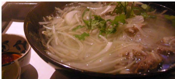
越南米粉

越南米粉看似平淡无奇，汤头里却大有学问。三磅牛肉骨、一只小母鸡、加生姜、越南调料香茅、香菜籽、洋葱，一起放在锅内小火炖 3-5 小时，炖出的高汤才是最正宗的。