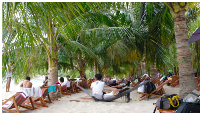
沙滩休闲时光

来到岷港一定要到海边，玩玩水，吹吹海风，累了就躺在椅子上，闭上眼睛，享受岷港的日光浴，让整个人轻松下来。