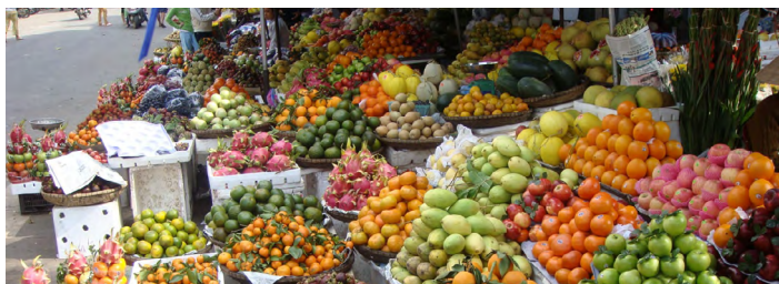
水果摊 Julien's Shots 摄

市场里的热带水果，价格至少比中国便宜一半，火龙果更是越南特产。花十几元人民币就能满载而归。