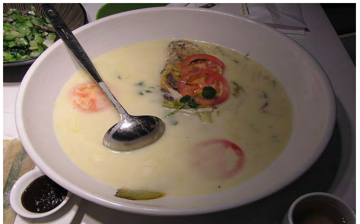
大黄鱼汤