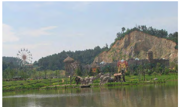
雅戈尔动物园