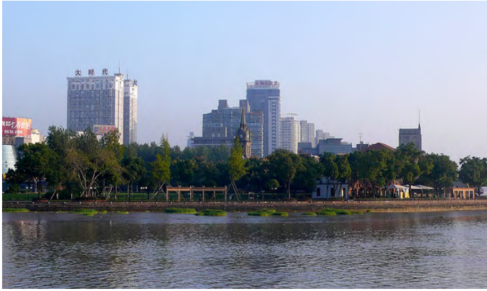
江北天主教堂