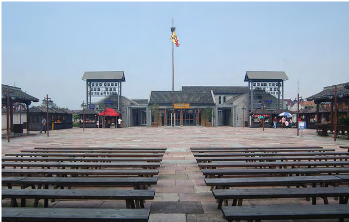
郑氏十七房

镇海郑氏十七房景区，位于宁波市镇海区海滨小镇澥浦镇，紧邻 329 国道，距上海 240 公里、杭州 170 公里、舟山 40 公里，杭州湾跨海大桥、舟山连岛大桥、杭甬高速、甬台温高速贯通四周，交通十分便捷。