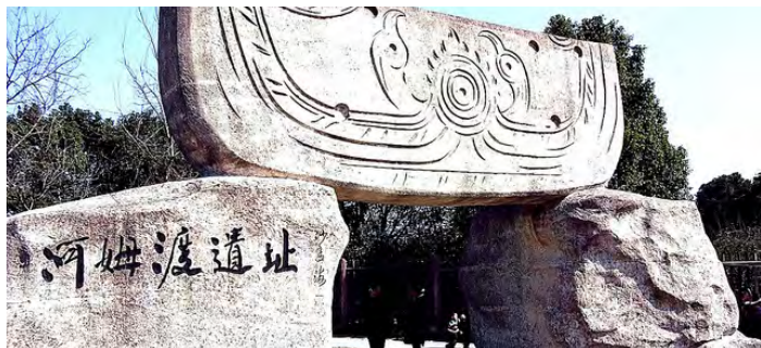
河姆渡遗址

河姆渡遗址是新石器时代遗址，遗址总面积约四万平方米，堆积厚度四米左右，上下叠压着四个文化层，其中，第四文化层的时代，距今约六千到七千年，是中国现已发现的最早的新石器时代地层之一。