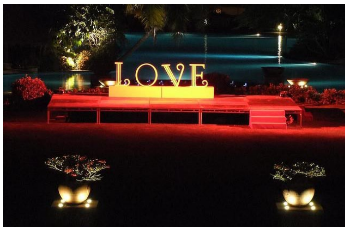
会场装饰

每年的 11 月在天涯海角举办国际婚庆节，为美丽的风景平添一丝浪漫的气息。婚庆节接受国际、国内新婚夫妇以及金婚、银婚等纪念婚夫妇报名参加，传达相伴终生的美好祝愿。