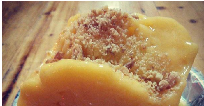
芒果炒冰

炒冰是海口夏夜消暑颇受欢迎的一种爽口甜品。用鲜果榨汁，混合炼乳，再冷凝盘上迅速翻炒，成冰，再加入各种当季水果制成各种风味的炒冰。