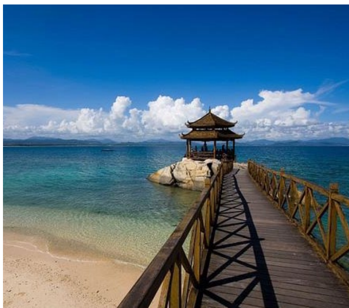
冬季的三亚

三亚的最佳旅游时间是 10 月至次年 3 月。但这里寒暑变化不大，所以一年四季皆适合旅游。