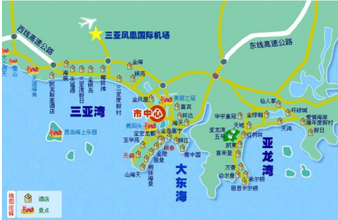
三亚宾馆大致分布