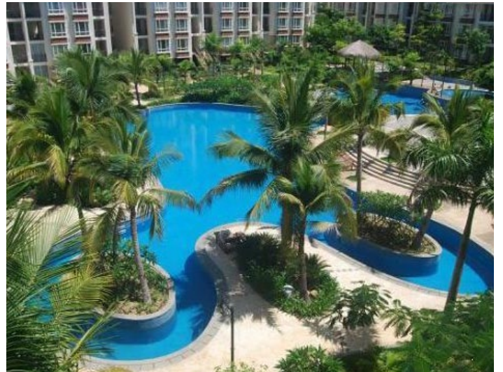
酒店泳池