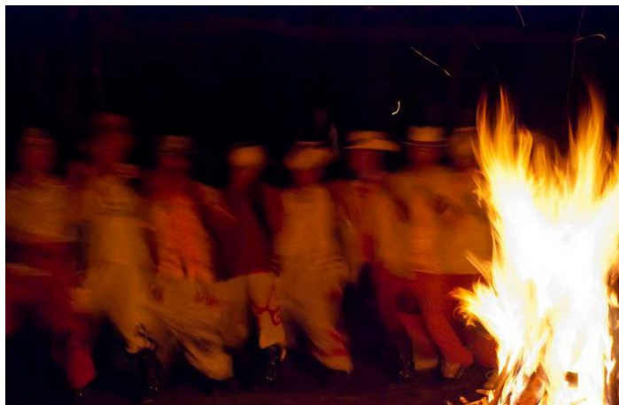
篝火晚会

“三月三”是海南黎族、苗族的重大传统节日。在农历三月初三，在整个三亚市范围内，将举行圣火传承、篝火狂欢、黎苗艺术展、民族体育竞技、黎苗美事、万人同跳竹竿舞、主题晚会、对歌比赛等，众多丰富多彩的民族活动。