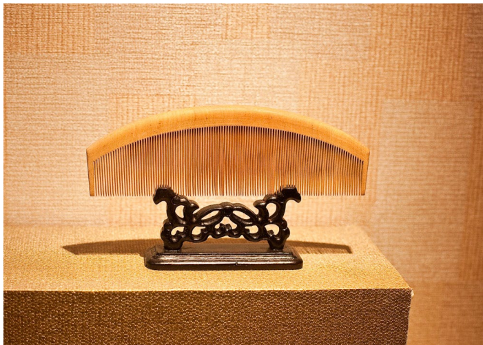
CultureIn cart 摄

梳篦是常州著名传统特产，方显常州特色。它选用上好材料，饰以多种手工技艺如雕刻、描烫等进行加工，外观精巧美丽，而且十分实用。