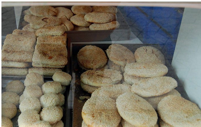
Dennis wu_ 双桂坊摄

常州大麻糕具有独特口感和风味，是一种椭圆形大烧饼，有咸、甜两种选择。麻糕一出炉，香味浓郁扑鼻，色泽黄润而不焦，咸甜适度而不腻。当地人一般作早点食用。