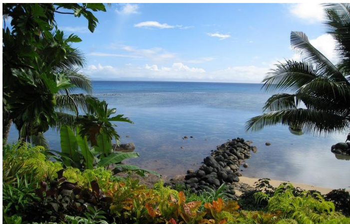
茂盛的植物