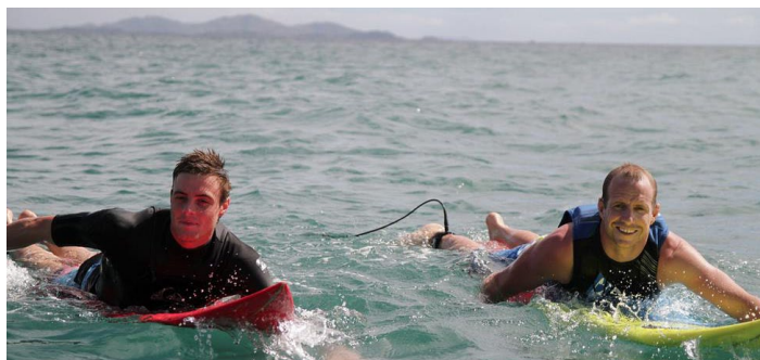
水上滑板

若你是划水老手或者乐于体验海上冲刺的快感，那么就绝不能错过斐济的极限水上滑板运动。若你是初学者，那么可以选择早晨去划水，这时的海面更为平静。而经验丰富的滑板爱好者可以选择中午或下午，这时的海面更为波澜，也会更加刺激。