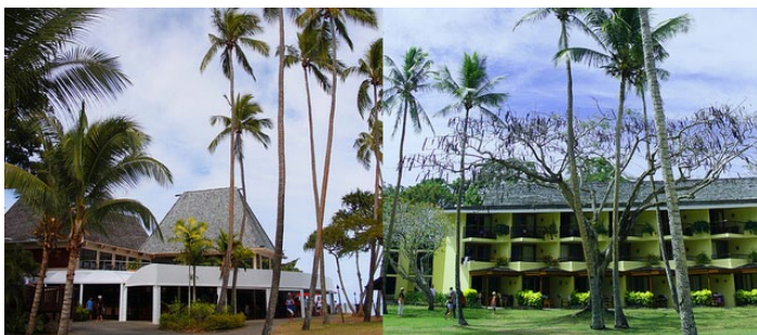
香格里拉斐济酒店

度假村位于占地109英亩的私人海岛——雅奴卡岛，酒店四周环绕着洁白的沙滩、青绿的礁湖以及随风摇曳的棕榈树。酒店通过一座桥与主岛相连，交通便捷，外观的设计灵感取自时尚斐济的主题。