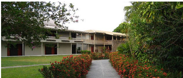
诺富特纳迪酒店

诺富特纳迪酒店是一家4星级酒店，客房装潢融合了现代和传统斐济风格，房间或配有私人钢琴，或带有可俯瞰斐济美景的阳台。