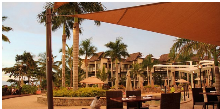
斐济迪那桡岛雷迪森度假村

斐济迪那桡岛雷迪森度假村提供全套SPA服务、5个室外游泳池、健身俱乐部和滑水道。在公共区域提供免费无线上网，并且酒店内设有上网点。度假村内设有4间餐厅，以及泳池酒吧、池畔酒吧和酒廊。