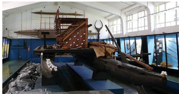
出海的渔船

博物馆里藏品丰富，从 3500 多年前的石器，到英国人征服斐济用的来福枪和牛皮封面圣经都讲述着斐济的历史。一件满清时的长袍马褂，上面写满有关华人登陆斐济的文字。