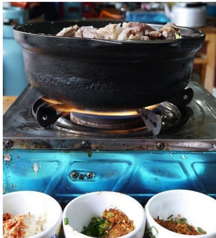
腊排骨火锅 HANABI428 摄 地址：象山市场内

典型纳西风味，足量的锅底和美味的腊排骨都是十分的诱人。还有水焖粑粑也要尝尝，不过要等。这家店据说开了20年了，很有名气，去吃的本地人和游客都有。去的时候常常是人声鼎沸，生意超级好。建议去的话要早一点，不然没位置。