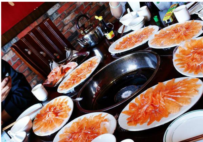
膜拜祖德神教的小漪子 Stella 摄

丽江的三文鱼并不是我们所熟悉的海产三文鱼，而是当地特产的虹鳟鱼，是由雪山融化的雪水养成的。肉质细嫩，口感爽滑，是一种不可多得的美味佳肴。