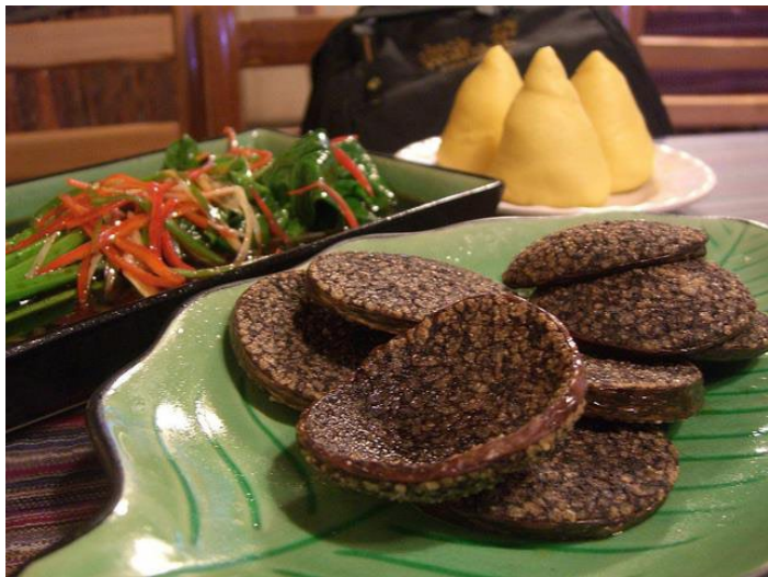
米灌肠配窝窝头

米灌肠是丽江特有的风味食品，在食用时切成圆片，用油煎炸或蒸熟，香味浓郁，而且营养价值也非常高。