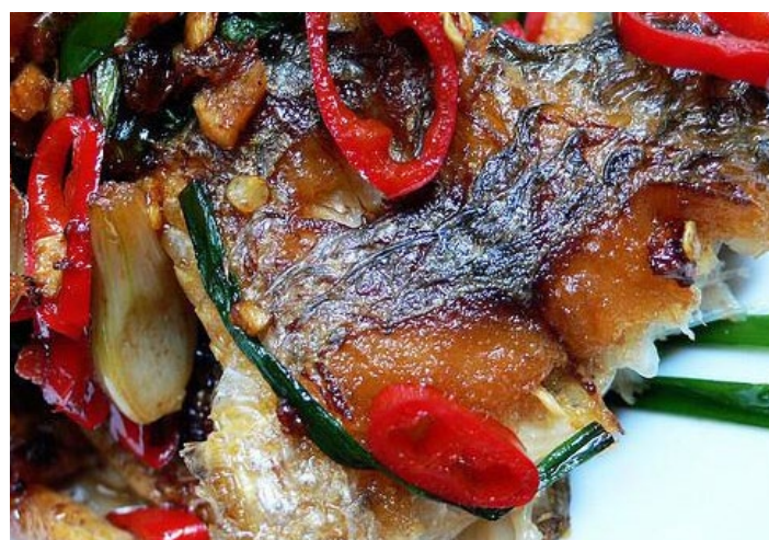
红烧罗非鱼 地址：七星一街（近光辉酒店后墙）

罗非鱼又名福寿鱼，也叫非洲鲫鱼。汤很鲜美，鱼肉很嫩。很有名气，当地人常去的。大家都坐在一个矮矮的草墩子上吃饭，也许这就是店名的由来吧。清汤锅底奶白醇厚，麻辣锅底花椒香气扑鼻。