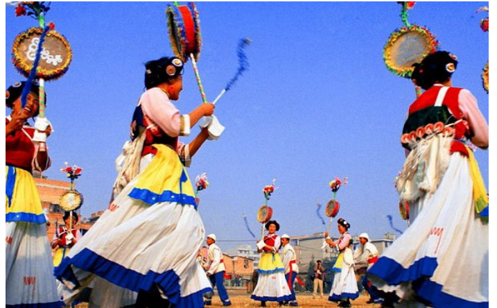
时间：农历七月中旬（持续十天左右） 地址：大研古城

七月会是纳西人的又一重要节日。又称“七月骡马会”。七月会历史悠久，远近闻名。节日期间，纳西人来到大研古城赶会，逛会，看展览，看演出。