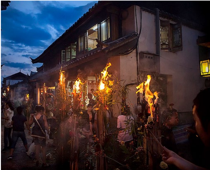
时间：农历六月二十五至二十七日 地址：大研古城

火把节以丽江大研古城最为热闹，纳西人一连要过三天的火把节，点三个晚上的火把。每天门前要点一支大火把，寨子里的青年们个个拿着小火把，沿着田埂、山路，边走边唱，直到深夜。火把燃得越旺，就越吉利，人们越高兴。