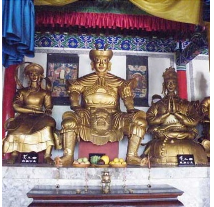
寺庙中供奉的三朵神

三朵节是纳西族最为盛大的民族节日，每年的二月初八，要用全羊祭祀，当时正是茶花初开之时，人山人海，花开遍野。