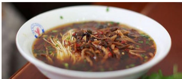
酸辣面 Jung83 摄 地址：古城区七一街

在四方街往七一街内走一小段就到了。喜欢吃辣吃面条的朋友可以去看他家吃。麻辣面，抄手，酸辣粉很好吃，也不贵，五六块一碗。生意很好，店很小，就四张桌子，有时候要等位置。