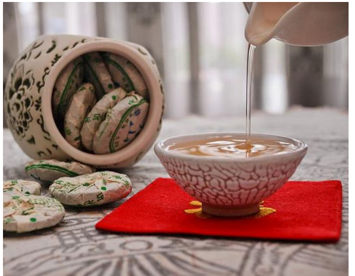
生普洱 martinachina77 摄

云南是普洱茶的产地，价格根据它的年份、产地、品种等因素而变化，一个茶饼最便宜的也要七八十。但这个东西和文物、金银饰物等高端物一样，是需要一定鉴别知识的。如果你不是品茶高手，请勿随便听信商饭店主的忽悠。