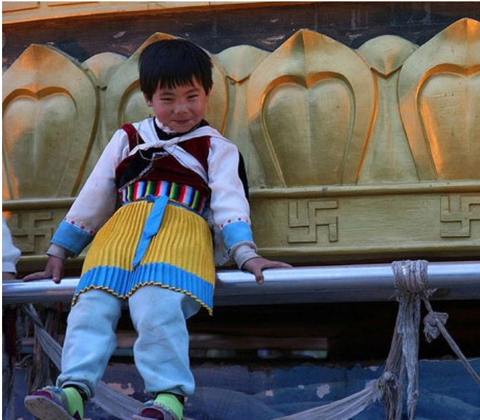
身着节日服装的纳西族小女孩 时间：农历三月五日 地址：丽江玉水寨

节日期间，东巴族人早早来到玉水寨东巴什罗庙。点燃香炉，烧大香，祭拜神灵和祖先，祭拜东巴始祖东巴什罗，并且诵经，做法事。期间，东巴们会诵东巴经，跳东巴舞，相互交流切磋。