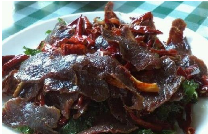
干煸耗牛肉 地址：新义街积善巷 69 号 电话：13036813540

各种炒菜，本地纳西人开的。他们家的牛肉做的很不错，土豆炖牛肉，牛肝菌，干煸洋芋丝等都是热门彩色，价格适中。