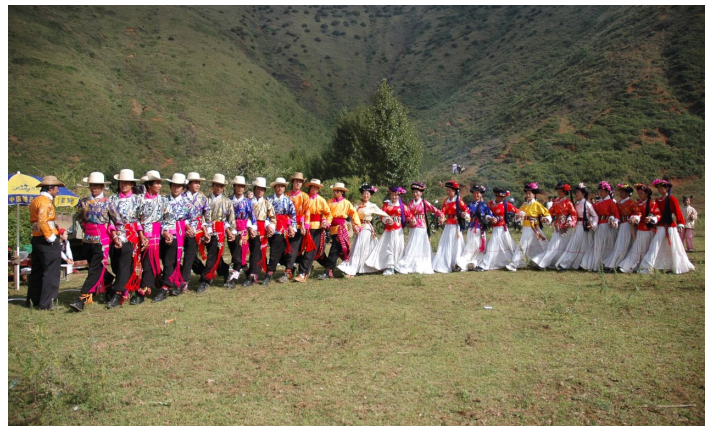
时间：农历七月二十五 地址：泸沽湖

转山节是泸沽湖摩梭人最重大的节日，又称转山会。节日期间，摩梭人都穿上最华丽的民族服装，进行祭拜女神、歌舞、射箭、结交阿夏等各种活动。