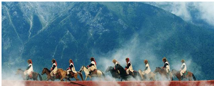
《印象丽江·古道马帮》

《印象·丽江》是继《印象·刘三姐》之后推出了又一部大型实景演出，上篇为“雪山印象”，下篇为“古城印象”。《印象·丽江》以雪山为背景，融合当地少数民族的风情，在海拔 3100 米的高原演出，震撼人的心灵。