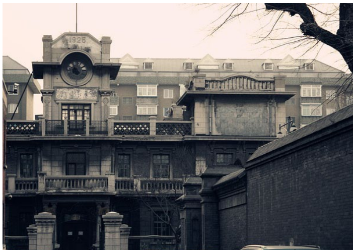
沈阳 - 大帅府

沈阳给人的印象，有一些沧桑，也有几分硬朗气概，就像这里的东北汉子。曾经的盛京如今多了不少现代感，中街的喧嚣霓虹、东北最高的摩天楼、热闹火爆的刘老根大舞台，昔日的皇城根儿俨然披上了大都会的光芒，成为东北地区的核心城市。