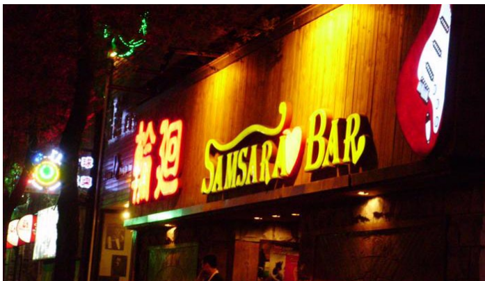
沈阳夜店

除了传统的二人转外，沈阳也不乏现代时尚的娱乐项目。沈阳就有几大酒吧街。西塔地区是朝鲜族风情街，经营着众多的酒吧、餐厅及娱乐场所。三好街酒吧一条街位于沈阳市沈河区文化路，有近 30 家大小不同，风格各异的酒吧；酒吧设计古朴典雅，有浓郁的欧美风情。崇山路的酒吧也很有特色，一般学生比较喜欢光顾。五里河体育场附近，酒吧比较集中。