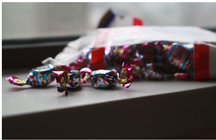
不老林糖

不老林糖是由“北方制糖大师”林瑞丰独家创制的糖果，是沈阳的著名特产。不老林糖曾在上世纪九十年代初风靡全国，其口感香醇细滑、甜而不腻，有各种口味，至今深受大家欢迎。