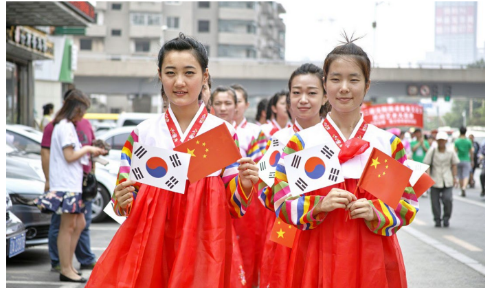
2013 沈阳韩国周大巡游的朝鲜族女青年

沈阳会在每年举办中国沈阳韩国周，旨在促进沈阳与韩国的多层次友好交流。届时将有各项丰富多彩的活动，包括可以看到不少韩国演艺明星的演出。除了文艺、文化活动之外，同时还将举办中韩旅行商大会。若对韩国文化感兴趣，那么这个节日可别错过哦。