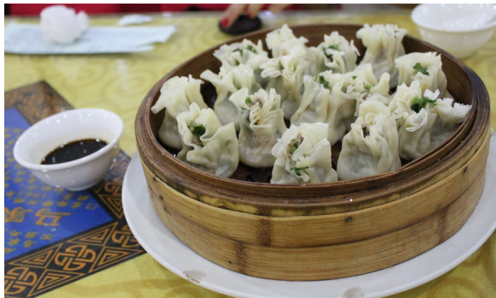
马家烧麦

沈阳中街的马家烧麦是沈阳最早的回民饭店，始创于 1792 年。马家烧麦选用上等的面粉制作烧麦皮，以新鲜牛肉紫盖、三叉等部位作馅，其制作精细、造型美观、口味好，所以深受群众欢迎。