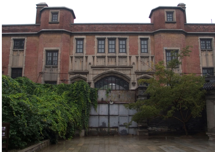
张氏帅府西院