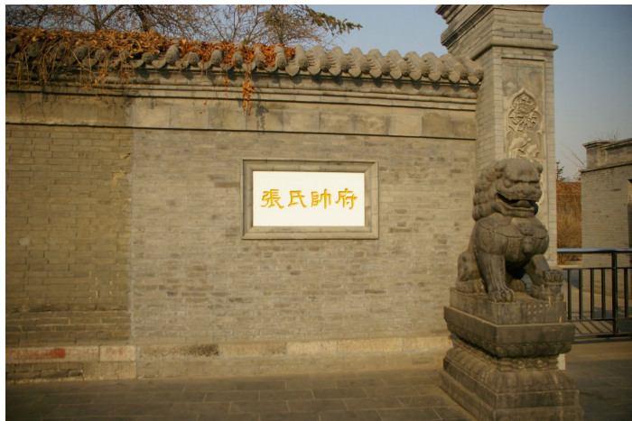
沈阳张氏帅府

作为东北地区保存得最完好的名人故居，张氏帅府中的大小青楼、赵四小姐故居，以及各种亭台楼阁无处不散发着民国的气息。在帅府中静下心来逛逛，倾听那些战乱年代的传奇爱情故事，你的心中会有怎样的感触呢？