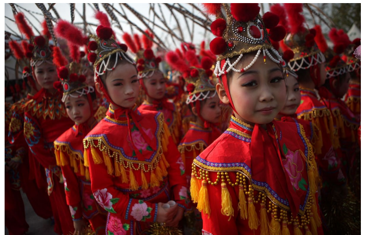
International Tourism Festival

沈阳国际旅游节是当地最为热闹的旅游节庆，期间将有各种丰富多彩的主题活动亮相，如开幕式汇演、花车盛装巡游、东北民族民俗传统舞蹈表演、现代创意表演等；同时还会融合美食节、购物节、啤酒节、采摘节、摄影大赛、国际著名景区的推广会以及商品展示会等精彩的活动，是名副其实的交流与欢乐的盛会。