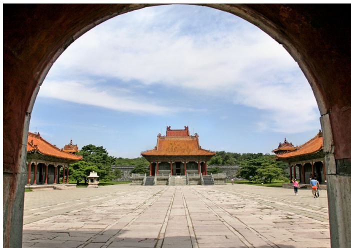
清昭陵隆恩门

沈阳市区北部的北陵公园内坐落着清朝第二代开国皇帝皇太极及其皇后的陵墓—清昭陵。昭陵通常被称为“北陵”，建于 1643 年，是清初关外陵寝中最具代表性的一座帝陵。园内草木葱郁、古树参天，这里山、水、楼、林俱全，是皇家陵寝和现代园林合二为一的游览胜地。