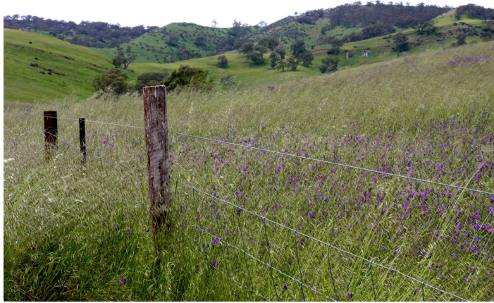
熏衣草庄园

沈阳紫烟熏衣草庄园位于沈阳市沈北新区马刚乡马泉村，沈阳国家森林公园西南侧（距沈哈高速公路清水台出口 10 分钟车程），占地面积 5000 余亩，核心区域 1600 亩。庄园以“爱情、浪漫、最美之地”为主题，是集熏衣草及其他香草景区观光、影视摄影拍摄基地、礼仪庆典、熏衣草产品开发、会员制五星级度假酒店（规划中）、剧场、森林氧吧健身中心，特色餐饮娱乐服务于一身的现代化休闲度假庄园。