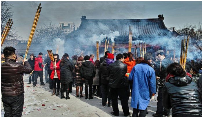
2013 春节沈阳皇寺庙会之祈福求佑

沈阳的实胜寺又称为“皇寺”，每年的重大节日期间这里都会举行热闹的传统庙会。届时可以欣赏到高跷、秧歌、舞狮梅花桩、民间吹打、绝活绝技表演、二人转、评剧、“大威金刚舞”等丰富的文体表演。此外庙会还设置了风味小吃、服装鞋帽、烟酒糖茶、土特产品、旅游商品五个展区。人们更可在这里看到糖画、皮影、蛋雕、剪影等各种传统民间手艺。