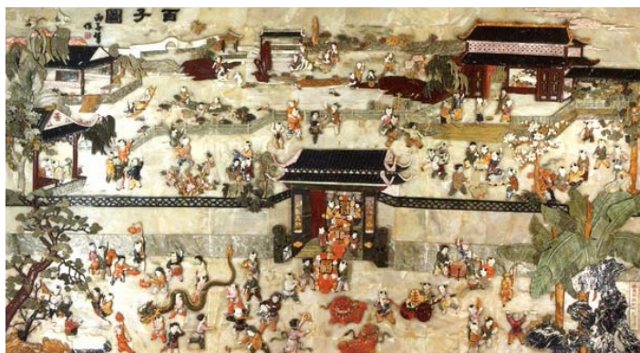
彩石镶嵌画

彩石镶嵌画是沈阳较常见的民间传统工艺品，是以各种颜色的天然大理石为主，并以枯石、玛瑙、汉白玉、金星石等彩石为原料，运用大理石各种彩石的自然形态特征、纹理脉络和丰富的色彩，汲取古代壁画艺术制成的石质画工艺品。