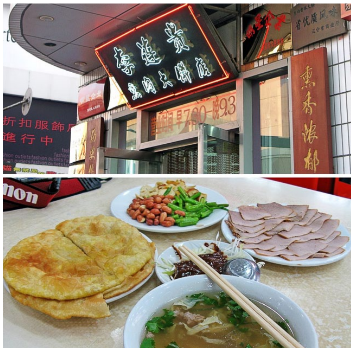
李连贵熏肉大饼店

李连贵熏肉大饼虽然不是沈阳的原生特产，但在沈阳城已经火了不少年头了，早已成了沈阳人最喜爱的风味美食之一。酥酥脆脆的大饼夹着香嫩的肉，就着鸡蛋汤，这美味只有尝过才知道。