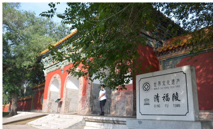
瀋陽清福陵, China Kuanping Lin 摄

东陵公园位于沈阳市东部近郊，公园内是清朝太祖皇帝努尔哈赤和皇后叶赫那拉氏的陵墓，陵号为“福陵”，人们也习惯称为“东陵”。这座拥有 380 多年历史的皇家陵墓依山傍水，环境幽静肃穆，而这里的建筑则气势宏伟，处处彰显着皇家的威严。福陵与沈阳的昭陵、新宾县永陵合称“关外三陵”。