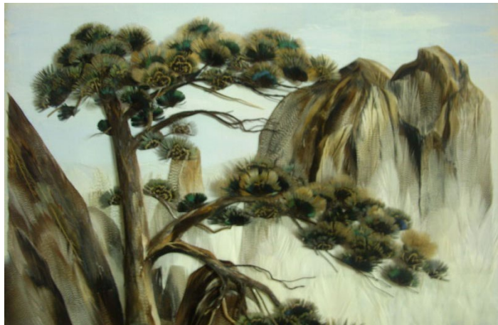
羽毛画

沈阳羽毛画是沈阳的特产工艺品，通常以孔雀、锦鸡、血雉等禽鸟的羽毛为原材料，再上塑模后用水粉颜料作画而成。沈阳羽毛画题材广泛、色彩绚丽，无论山川、人物、花鸟、鱼虫甚至神话故事等均可入画，富有浓郁的装饰性。