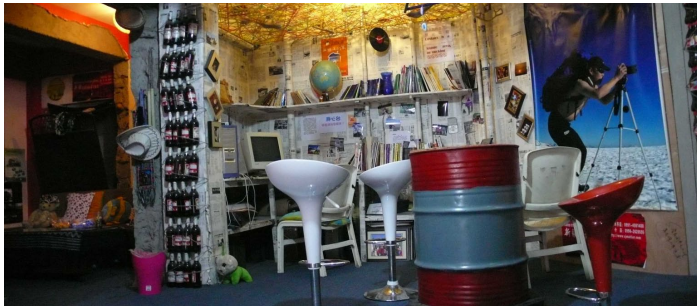
三皮青年旅舍

三皮青年旅舍位于市区北部，离北陵公园约 1.5 公里，离沈阳北站也不远。旅舍的内部格调和装饰均具有国际青旅的特色，且价格实惠，是驴友们的温馨驿站。