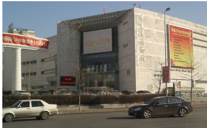
辽宁省博物馆 PHO100121-029

辽宁省博物馆是新中国成立后的第一座博物馆，目前共有近 12 万件精品馆藏，以辽宁地区考古出土文物和传世的历史艺术类文物为主体。透过丰富的历史文物以及辅助资料，人们可全面地了解到辽宁省乃至东北地区的历史概貌，是历史爱好者不可错过的去处。