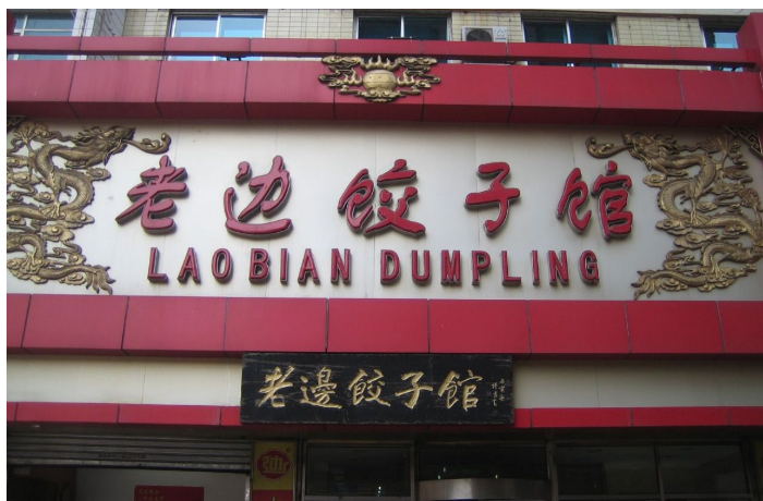
有名的“老边饺子馆”

百年老字号的老边饺子馆以花样层出的各种美味饺子出名，其中冰花煎饺、焗馅饺子、三鲜饺子最受欢迎，此外还有虾爬子饺子、百花饺子、酸菜饺子等特色饺子。