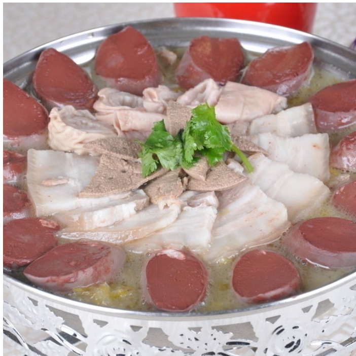
白肉血肠

那家馆始创于清朝同治末年，距今已有 130 多年历史，是由满族人那吉有所创。那家馆白肉血肠的特点是：选料考究、制作精细、调料味美；白肉肥而不腻、肉烂醇香、血肠明亮、鲜美细嫩；配以韭菜花、腐乳、辣椒油、蒜泥等佐料，更加醇香鲜嫩，脍炙人口。