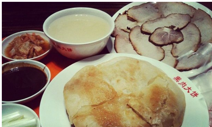
262/366. 熏肉大饼 . Fiorano~ 摄

李连贵熏肉大饼在沈阳是家喻户晓的特产小吃，熏肉用 10 余种中药煮肉，其皮肉剔透、肥而不腻，大饼则用煮肉的汤油加面粉、加调料调成软酥，抹在饼内起层，外酥里软、滋味浓香。实际上这个美食是在 19 世纪中叶于吉林省四平市首创，1950 年创始人李连贵的后人继承祖业，背着老汤迁到沈阳，在中街西头广生堂胡同开设了李连贵熏肉大饼店，从此名声大噪，成为辽沈地方风味名品之一。