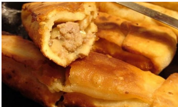
沈阳回头

沈阳回头是一道独特的清真小吃，历史悠久。其做法是将面粉揉好面团，用手将剂子按扁、擀平、抽薄、上馅，折叠成长方形再把两头包紧制成，其色泽金黄、皮焦馅嫩、口味鲜香。