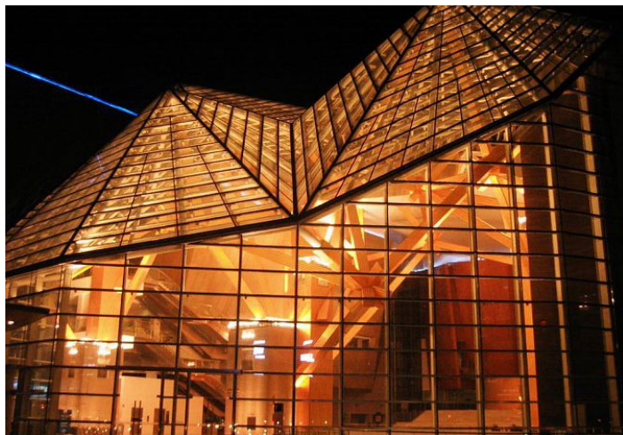
深圳音乐厅

人气最旺的文化场所有深南中路与红岭路交汇处的深圳大剧院，红荔西路与益田路交叉口的深圳音乐厅，还有被市民誉为“文化公园”的深圳书城。