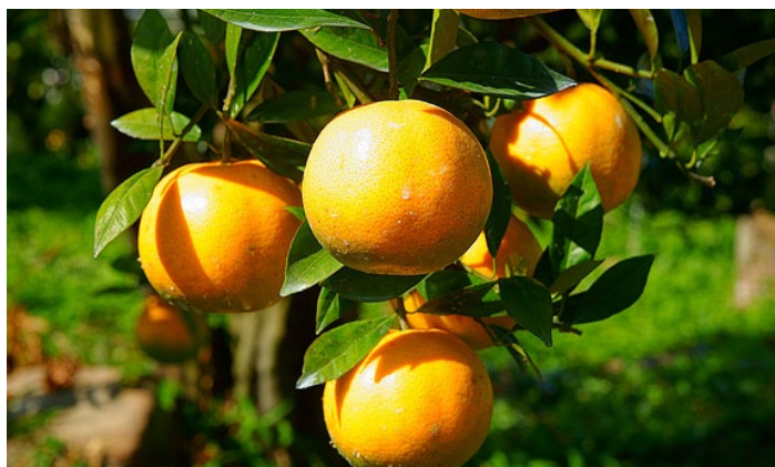
sunshine 莊信賢影像世界 摄

主要产地坪山、金龟、马兰。颜色金黄鲜艳，肉质丰厚多汁，味道甘甜纯正，而且每个橘子多带碧绿的叶子，十分惹人喜爱。