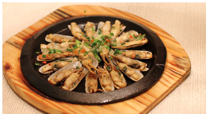
All by Cathy Ding 摄

蛭壳薄体长，呈棕黄色，合抱犹如笔杆，用蛭肉拌上韭菜包饺子，炖豆腐，味美无比。蛭，是火锅的调料之一。