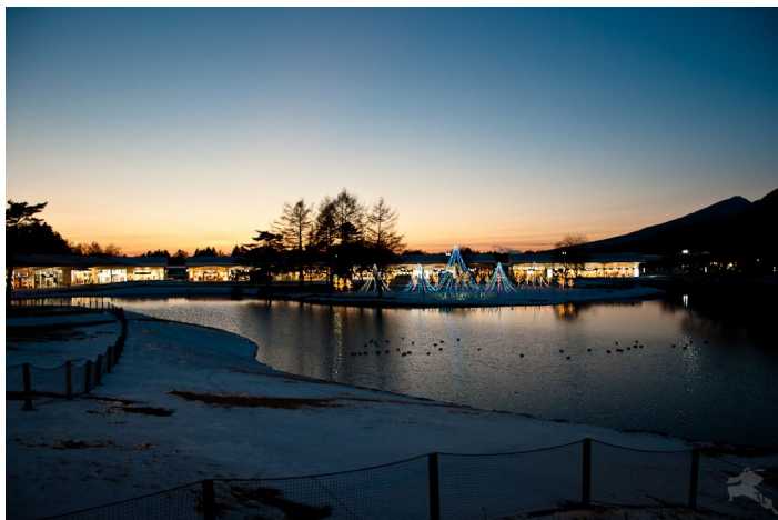
pirate M 摄

葫芦岛龙湾海滨滑雪游乐场 2002 年 3 月开始兴建，占地面积 80 万平方米，地理位置优越，依山傍海。是集旅游、餐饮、健身、休闲、娱乐等项目为主的多功能，多层次的大型综合健身娱乐场所，一年四季全天候开放的滑雪场。