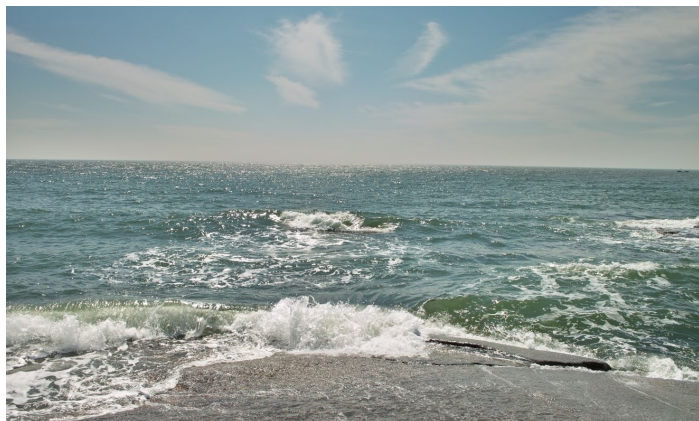
觉华岛的海

觉华岛原称菊花岛，位于兴城海滨东南方向，在兴城被称为“海上仙山”，据说是古代除暴安良的女神菊花仙子的化身。是渤海湾最大的岛屿，岛南端有张山岛和杨家山岛，北端还有状如磨盘的磨盘山岛。