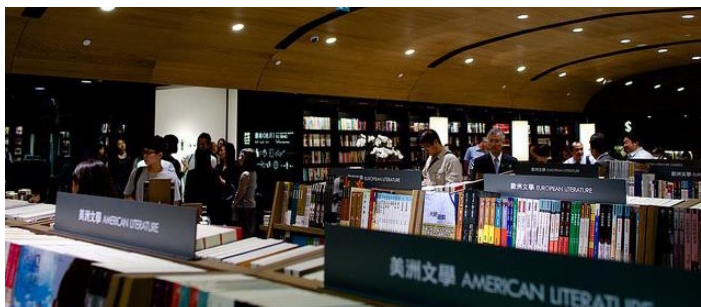
香港诚品书店

香港书店之多，且能买到很多内地买不到的书。另外还有分布在旺角西洋菜街及湾仔的一些特色二楼书店，常能买到不少冷门书，边缘文学、前卫艺术、严肃哲学等。