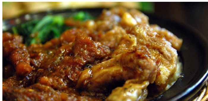
排骨凤爪煲仔饭

港式煲仔饭是把淘好的米放入煲中，量好水量，加盖，把米饭煲至七成熟时加入配料，再转用慢火煲熟。。再加上有秘制的豉油皇浇于饭面，更加突出其香醇。