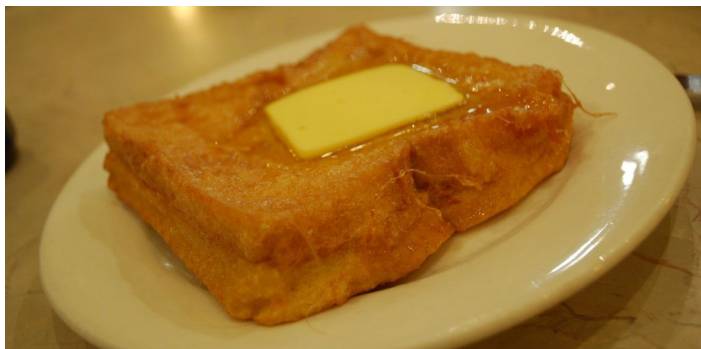
西多士 avlyxz 摄