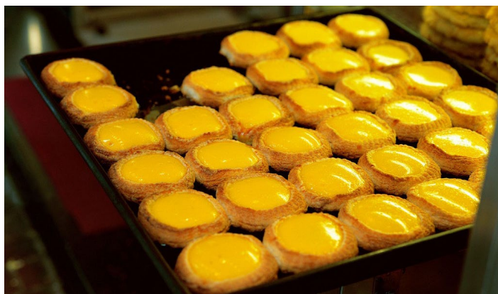
蛋挞出炉