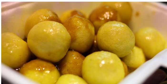
咖喱鱼蛋

炒过的咖喱粉将咖喱味带出，再加调味和水慢慢勾成芡，沥干水的鱼蛋在芡汁中煮熟，味道鲜美。