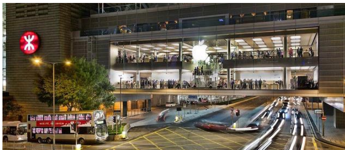
苹果专卖店

香港手机比内地价格便宜，香港丰泽是香港规模最大的电器连锁店，除经营手机外，还有各种家用电器、数码产品等。相似的大型电器连锁店有 CMK，百老汇，苏宁镭射，价格基本为一口价。果粉请移步中环 IFC，希慎广场或者又一城的 Apple store。