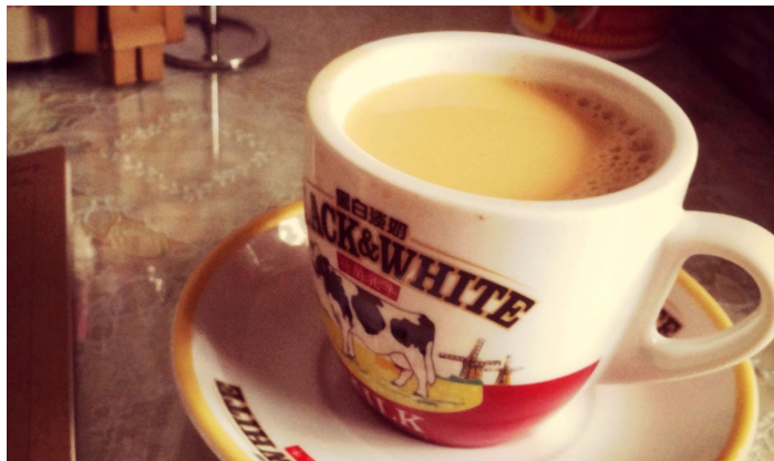
丝袜奶茶

所谓“丝袜奶茶”，其实就是把煮好的锡兰红茶用一个尼龙网先行过滤，然后再加入奶和糖。