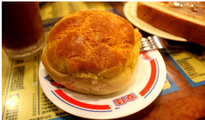
菠萝包庄

新鲜出炉的菠萝包夹上一大块冰冷的牛油，牛油在菠萝包中慢慢融化成金黄色，有股浓浓的牛油香味。