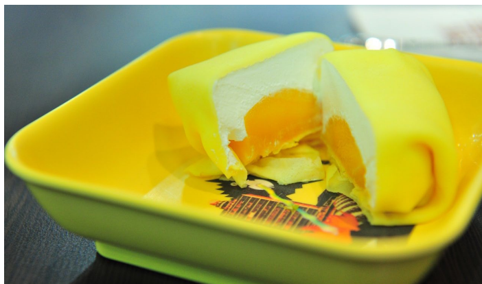
芒果班戟

香港人将芒果、奶油、Q劲十足的西式薄相结合饼，最后以叠包裹的方式，把馅包起。冷藏后的芒果班戟口感更佳。