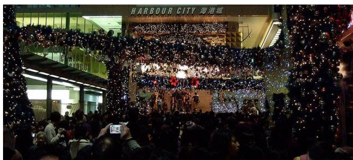
海湾城平安夜 Chronicle of Random Happenings 摄

全港最大的购物商场，这里有全球第二大的 LV 专卖店和数十家国际品牌专卖店。海港城之大足以让游客逛满一天。服务员的服务质量很好，普通话整体水平也比较高。