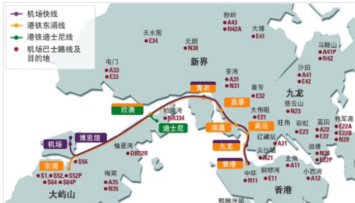
机场快线与机场巴士路线图

香港国际机场是世界十大航空港之一，因此搭乘飞机前往香港，或者从香港出发都是比较方便的。