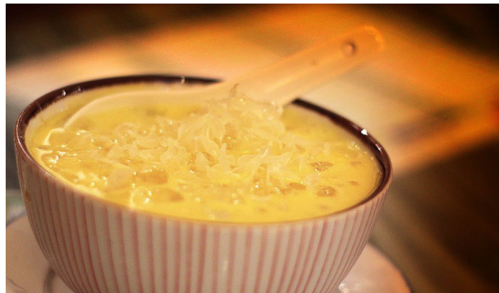
杨枝甘露

杨枝甘露是一种港式甜品，主要由西柚和芒果煮成，再配上三花淡奶和椰浆。制成杨枝甘露冷藏后食用效果更佳。