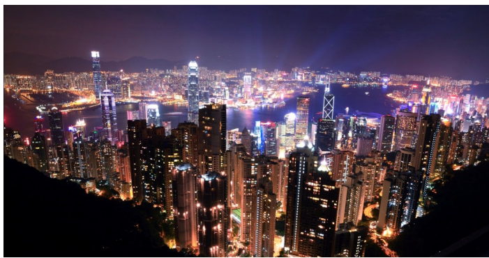
太平山顶景色

太平山是游客来香港的必经之地。山顶的观景台是鸟瞰维多利亚港和香港夜景的最佳地方。