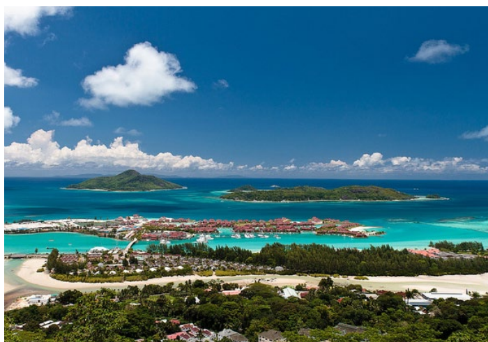
Eden island nachtwche 摄