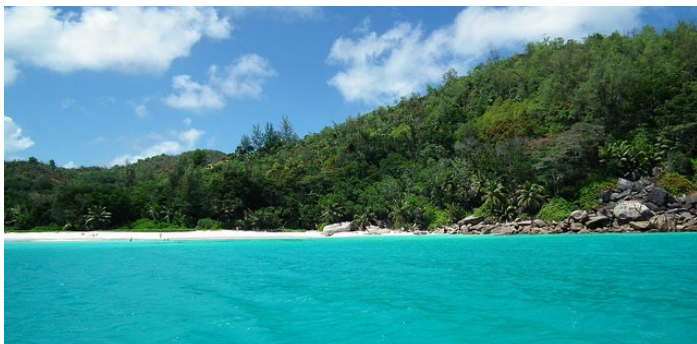
Lazio beach

普拉兰岛的拉齐奥海滩是美国《国家地理杂志》评选出的世界最美的海滩第二名。这个沙滩拥有奶油一般耀眼细腻沙滩（或者说成“面粉”更贴切）。这里环境安静清幽，没有热闹的游人，沙滩干净平坦，沙质细腻。