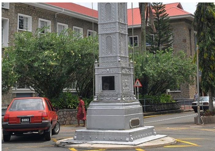
塞舌尔印象

维多利亚是塞舌尔的首都，也是最繁华的地带。小笨钟是维多利亚的标志，小笨钟旁边的邮局门口就是出现在很多游记里的海椰子雕塑。你可以和这个另类的椰子合照一张。在邮局可以购买邮票寄明信片。市区内，有很多漂亮的小教堂和小店，你可以随意逛逛。