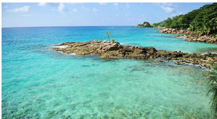
塞舌尔海滩

塞舌尔的许多海滩都还保持原始的状态，也没有熙攘的人群，在这样的沙滩静静的消耗掉的时光会使你体会到平常感受不了的平静。