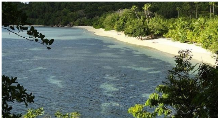
圣安妮国家海洋公园

圣安妮国家海洋公园被指定为 1973 年和印度洋中的第一个公园。公园中概括了塞舌尔的神秘海底世界，您可以在清楚的玻璃船上看下面的海底公园，同时还可以带上潜水面罩、通气管，穿上鸭蹼凫水。