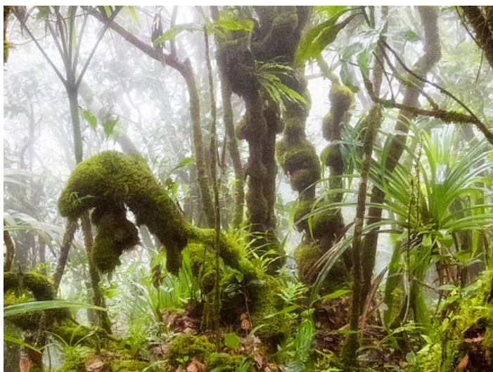
Morne Seychelles National Park

走进山谷之中，自行爬山找寻最美的景点，这里空气非常清新自然，在最高点可以看到非常美丽的风景。