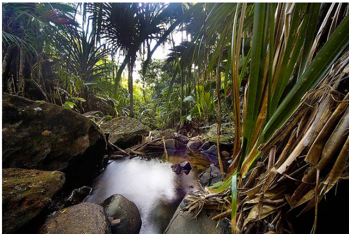
La Vallee de Mai

塞舌尔最大的标志海椰子就生长在五月谷。这里被誉为伊甸园，风景非常独特。海椰子分公母，形状如同男女的生殖器官，塞舌尔人称之为爱情之果。