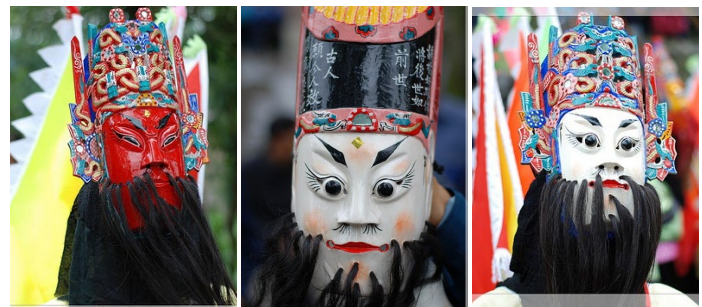
地戏脸子：关羽、诸葛亮、曹操

是婺源民间的一种由乡民穿戴戏衣，化装成人们熟悉的戏剧人物亮相游行的敬神与娱乐相统一的传统活动。每逢农历正月初、三月三、四月八和迎秋打醮时，不少地方都会演出地戏。地戏有地戏、马戏、抬阁和高跷等形式。