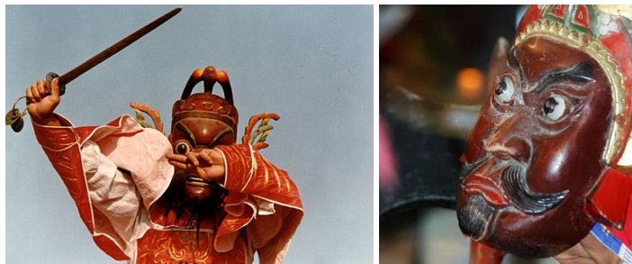
傩舞表演

又称鬼戏，是汉族最古老的一种祭神跳鬼、驱瘟避疫、表示安庆的娱神舞蹈。舞者带着各种质朴而夸张的面具，带有鲜明的无数色彩，后来逐渐发展成为民间舞蹈，常见于春节前后。